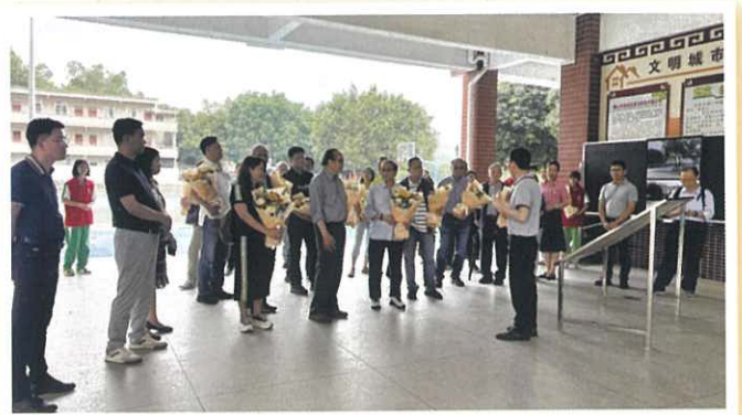
理監事參觀桃源中學

本會參觀後，得知該校是當地的標竿學校，學生成績理想，但資源有限，往往捉襟見肘，鑑於學生課堂的迫切需要，本會經理監事會議批准，已答允資助更新電腦共140台，費用約人民幣60萬元。