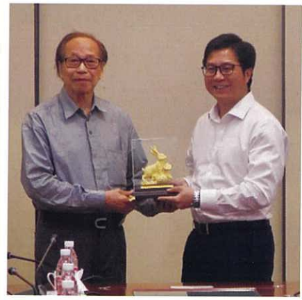
鶴山市市長張華景(右)與本會會長李純熙(左)互贈紀念品

中心是個非牟利公益項目，為成年智障人士提供日間照顧服務和康復服務，包括勞動能力訓練、社交及康樂能力訓練等，從而提高其自理能力，增加其融入社區的機會，與及就業自食其力。