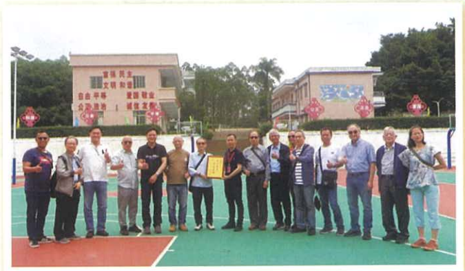
合成小學贈送紀念品與本會

及後，又因該校的運動場陳舊損毀，同鄉會再次捐贈人民幣62萬元，協助翻新。運動場已於2022年1月建成，跑道長200米，場中設有3個籃球場、兩個羽毛球場。參觀當天，有感設施完備，實在有助學生全人發展。