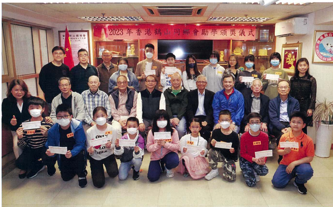
獲頒勵學獎項的大、中、小學生與理監事合照