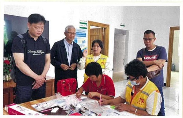
康園中心學員製作手工藝品