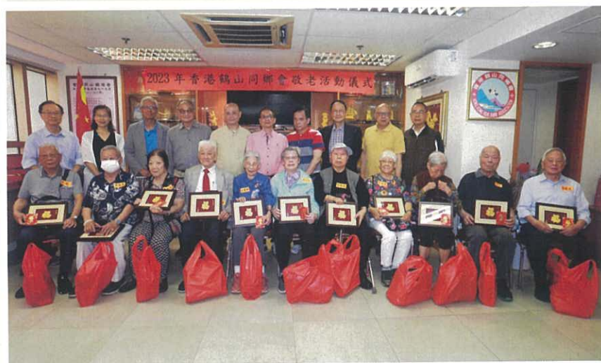
出席敬老活動長者與理監事合照