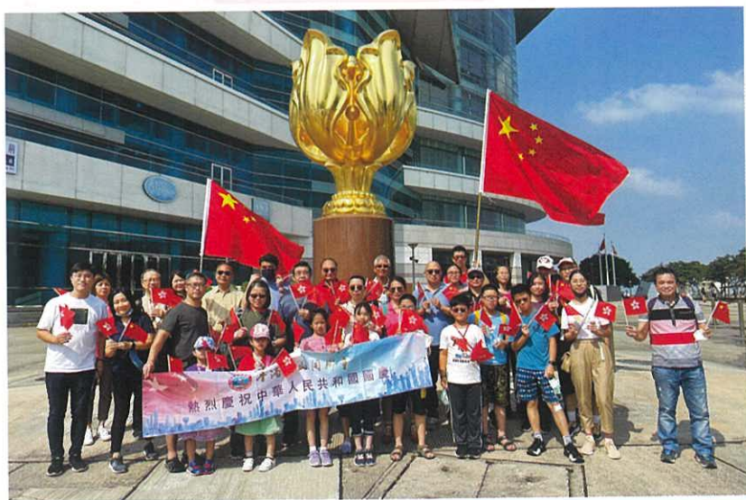
灣仔金紫荊廣場合照

時間轉瞬即逝，我們又接著下一個行程，去到最後一站——濕地公園參觀。這一站是小朋友們最興奮的一站，因為濕地公園裏有他們最想見到的鱷魚「貝貝」，還有小白鷺。如今「貝貝」已長到兩米長，有自己一個獨立的家。看來牠很快樂，在濕地公園裏過著無憂無慮的生活！我們也無拘無束、自由自在地遊覽參觀著，享受週日下午的悠閒時光！