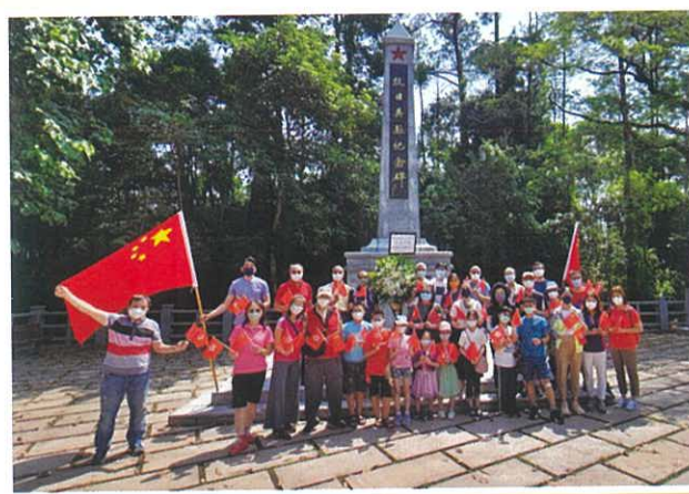
抗日英烈紀念碑前合照

眨眼行程已到尾聲，所有團員們特別是小朋友們都懷着依依不捨的心情登上了回程的巴士，興奮地討論著行程滿滿一天的趣事。同鄉會理監事還主持了國民常識問答比賽環節，所有同學都熱烈地參與其中。最後每位同學都獲得了一份小禮物，而優勝者更獲得一份神秘大獎，真是皆大歡喜！