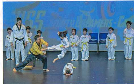
跆拳道演出，巾幗不讓鬚眉！