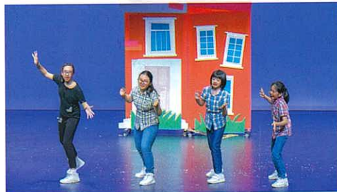
英文音樂劇演出，同學們載歌載舞，表現專業。