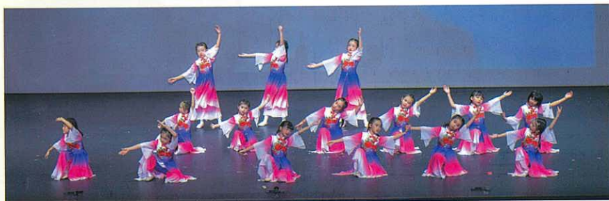
中國舞表演，都是由一、二年級的女孩子演出，表演動作都非常認真。