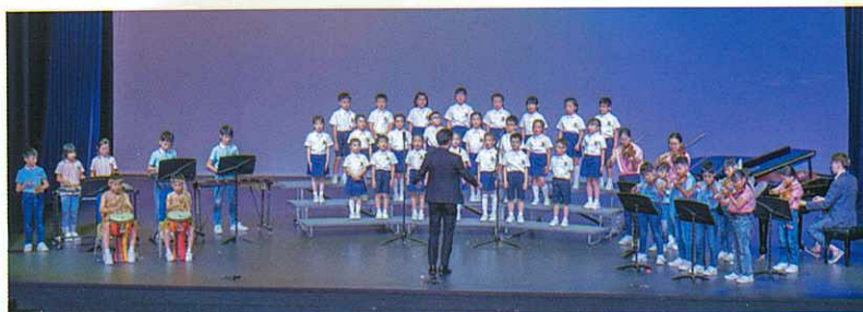
今年首次以音樂匯演的形式演出，每個同學都發揮所長，盡情演出。