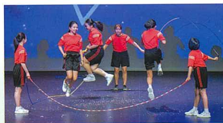
花式跳繩表演，見到跳繩隊隊員合作上也更有默契，技巧亦比以往純熟。