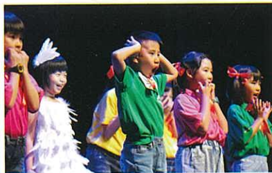
Words & Movements 以英文朗誦的形式配合身體動作在台上演出。