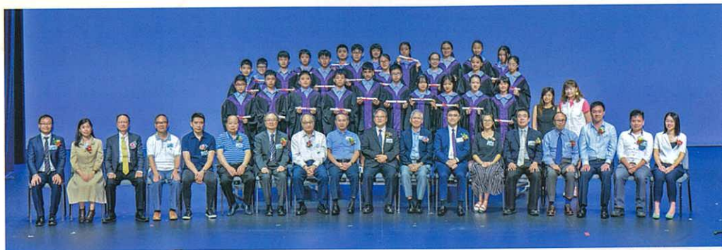
嘉賓與本屆六年級畢業生合照。

一年一度展示鶴山學校學習成果的「鶴·藝」綜合晚會，於2019年7月2日在柴灣青年廣場舉行。為了讓更多學生參與這個年度盛事，我們以不同形式的舞台演出，更透過繪畫和錄影等不同方式，讓學生表達自己的夢想，為本年度的主題——「夢想」，增添了不少色彩。