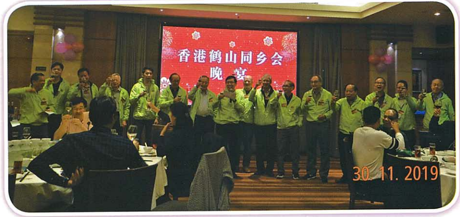
賓客又相互敬酒。大家樂融融，盡興而歸。

12月1日，部份會員選擇自由探親，部份會員則前往遊覽【鶴山文化廣場】。鶴山文化廣場面積18萬平方米，總投資5.9億元，有設施一流的文化館、人性化設計的圖書館、還有充滿詩意空間的博物館。博物館處處彰顯鶴山特色，富有古勞文化水鄉的水文特徵。午餐後，驅車前往中山港碼頭乘船回香港，結束愉快行程！