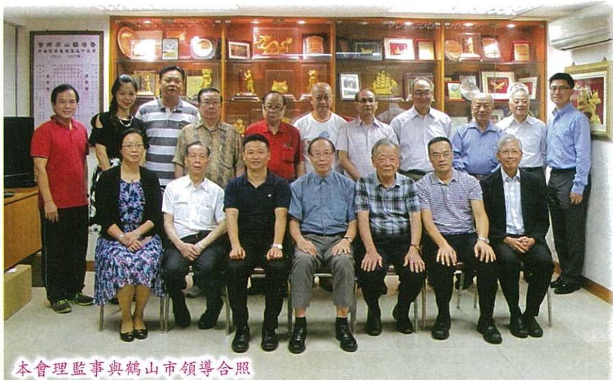
本會理事與鶴山市領導合照