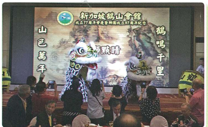
新加坡鶴山會館醒獅隊表演