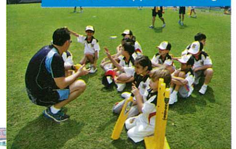
青苗訓練 Gappers Training

我們為學生引入不同的體育活動，他們能在一不一樣的體育課堂裏，有着不一樣的學習體驗。