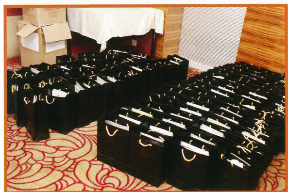
招募青年組迎新禮品