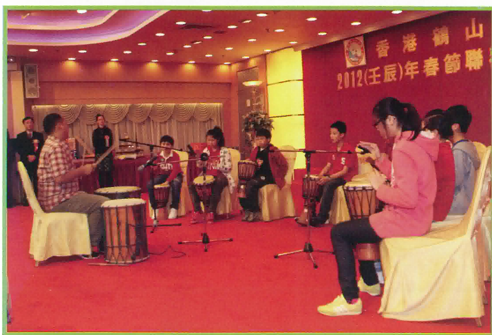
鶴山學校的同學表演非洲鼓