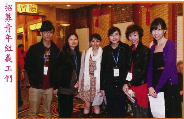
招募青年組義工們