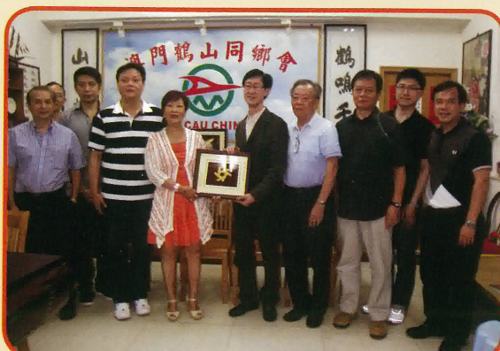
本會贈送紀念品給澳門鶴山同鄉會