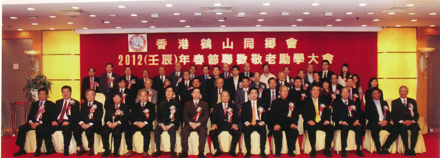
本會理監事與江門市、鶴山市領導及嘉賓合照