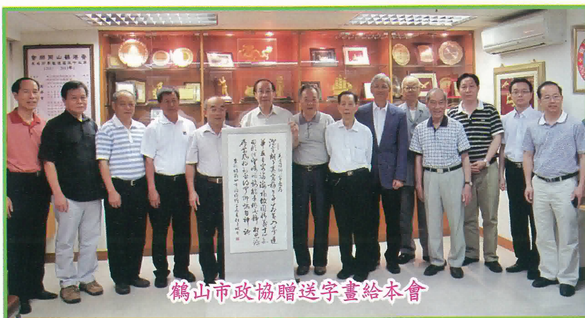
鶴山市政協贈送字畫給本會