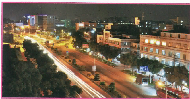
江沙公路夜色生輝