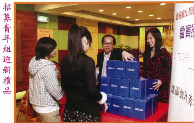
招募青年組迎新禮品