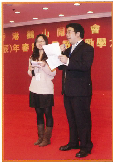
春節聯歡會勵學獎，由青年組擔任司儀