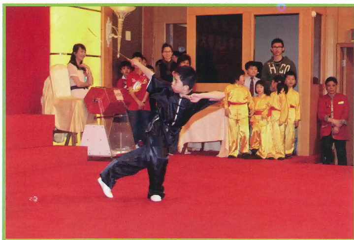
鶴山學校的同學表演耍劍