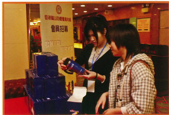
招募青年組迎新禮品