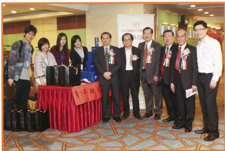
招募青年組義工與本會理監事合照

香港鶴山同鄉會於二零一二年三月三日舉辦壬辰年春節聯歡、敬老、勵學大會，「青年組」亦於當日舉辦新成員招募，來自本地大學的十多名優秀學生們擔任義工，向在場會員及年青朋友介紹青年組，並招攬入會。一眾義工眾志成城，入會人數反應熱烈，短短一瞬間已招募會員達七十位。青年組獲得東方表行集團有限公司、廣行海陸產品有限公司、三昌好好辦館有限公司、建興茶莊及一眾理監事的鼎力贊助及支持，並獲商界友好機構贊助禮品，令招攬場面更添熱烈。