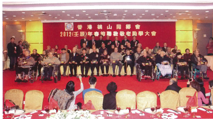
本會首長與九十歲以上長者合照