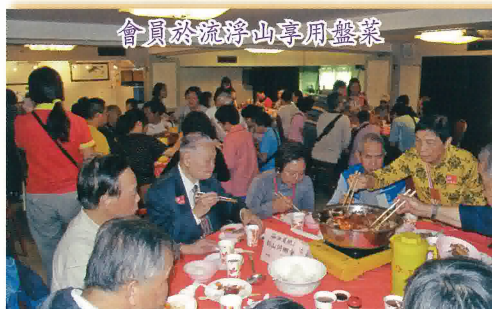
會員於流浮山享用盤菜

遊畢流浮山，我們順道前往參觀妙法寺，途中我們進行了抽獎活動，今次獎品有冬菇禮包，毛巾套裝和罐裝即食蠔。妙法寺位於新界屯門藍地青山公路廿二咪。於一九六一年由洗塵法師及金山法師聯同一眾護法創立。除了原有的萬佛寶殿，旁邊還建了一座新翼綜合大樓，設計概念揉合傳統及現代化之設施，以實用環保為主要設計概念，摒棄傳統不合時宜之佈局，所有裝修不求花巧，便於日後維修保養，以免浪費十方善信之淨施。設計雖然新穎，但不離佛法僧三寶之概念。頂層之玻璃幕牆，猶如一座碩大之水晶蓮花。大雄寶殿約高