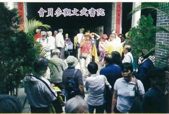
會員參觀文武書院

午飯於流浮山，享用少年廚神主理的精緻盆菜宴，席間會員聚首一堂開懷歡聚。午膳後於流浮山著名的海味一條街逛逛，親眼看見蠔王即席開蠔生晒，我亦買了數斤金蠔回家品嚐。流浮山著名特產又豈只蠔豉，還有其他海味，蠔油蠔汁等等，各團友都滿載而歸。