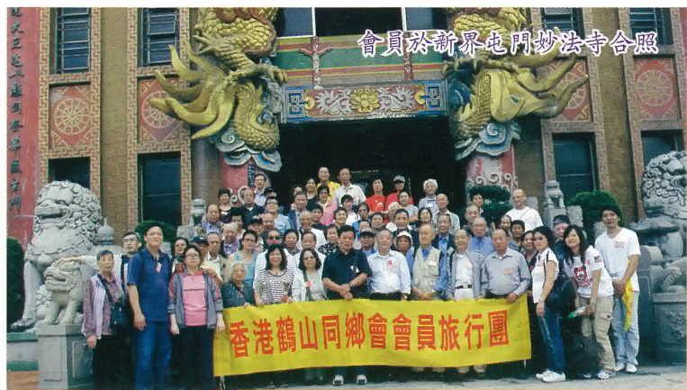
會員於新界屯門妙法寺合照

20米，殿內供奉高約八米之釋迦牟尼佛，旁立舍利佛及目犍連尊者。殿內無柱，面積達一千平方米，可進行大型佛事。