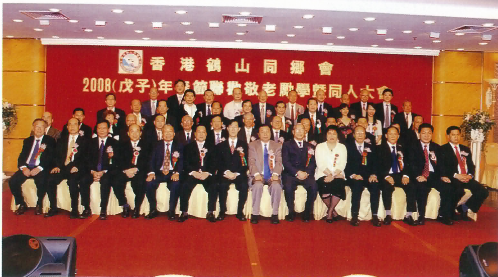
全體理監事與嘉賓合照

行海陸產品有限公司惠贈「第一鮑」澳洲鮑魚六罐，新都會酒樓送出酒席一圍，令抽獎節目更錦上添花。還有各界友會好友惠贈賞金花籃，令大會更添光彩。這次大會能夠順利進行，除得到本會理監事和職員的事前準備充足及青年組的熱情協助，更離不開各會員的積極參與，特此鳴謝！春節聯歡大會在一片歡樂共融的氣氛中於十時許圓滿結束。 總結今年的春節聯歡，鄉親參與的人數與現場的熱情氣氛實在令人鼓舞，足見我們鶴山人團結和共融。席間各親友互相祝酒，互相問好，彼此交換大家近況，充分肯定了本會一向團結鄉親、服務桑梓的宗旨。期望下一年的春節聯歡更勝今年的空前盛況，未能今年抽空出席春節聯歡的鄉親下一年緊記踴躍參與。