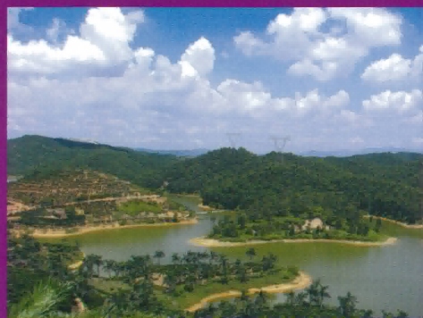
金合水庫美麗的自然風光