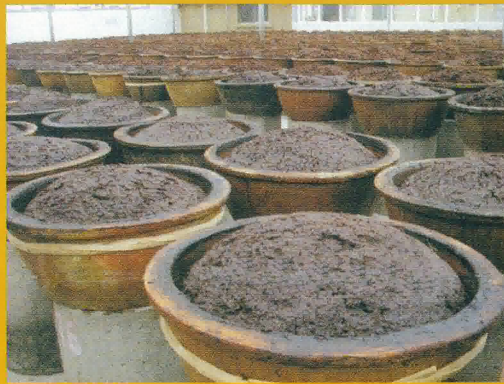
上千缸面豉整齊地排列在屋頂享受“日光浴”

沿用百年的天然生曬方法，令古勞面豉更香更鮮美。市非物質文化產品保護中心的負責人正鼓勵東古將申報為市級非物質文化產品。