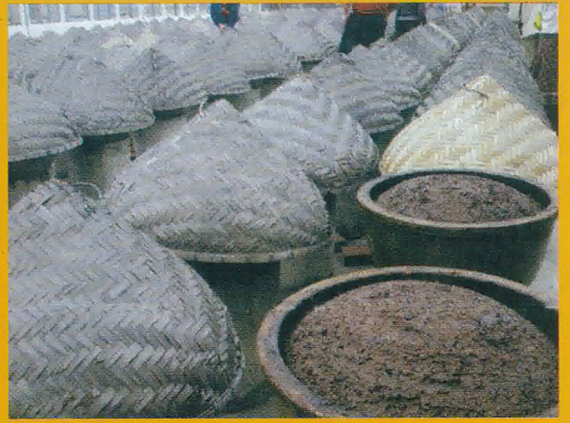
竹制的“官帽”是為面豉醬擋雨用的，裏面有塑料布做的夾層。