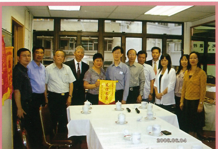
本會正、副理事長與鶴山市領導合照。