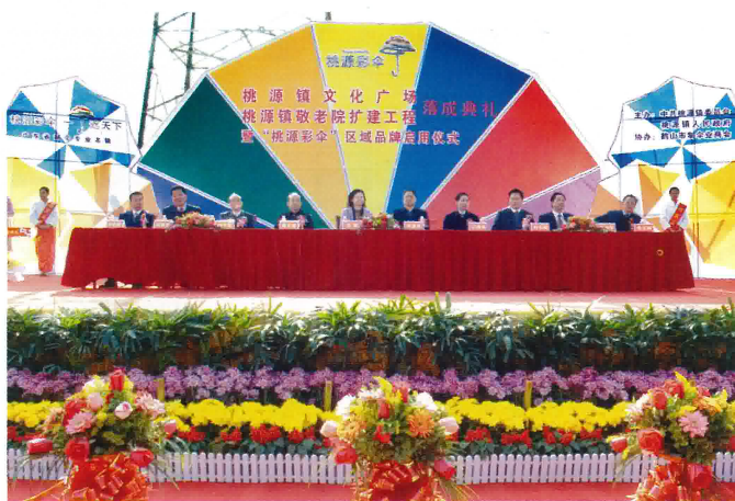
「桃源彩傘」區域品牌啟用儀式

今後，桃源鎮將繼續堅持以十七大精神為指導，貫徹落實科學發展觀和以人為本執政理念，堅定加快發展的信念不動搖，堅持走“基地+花園”的發展道路不動搖，振奮精神，真抓實幹，迎難而上，加快農村經濟結構調整，加快經濟增長速度，大力推進新農村建設，落實各項民心工程，努力建設和諧富裕新桃源。