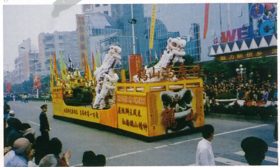
鶴山市新加坡七星獅鼓表演隊