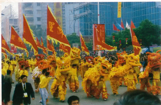
十六頭醒獅組成的表演隊