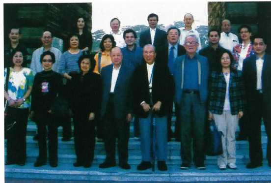
新會崖門海戰文化旅遊區合照