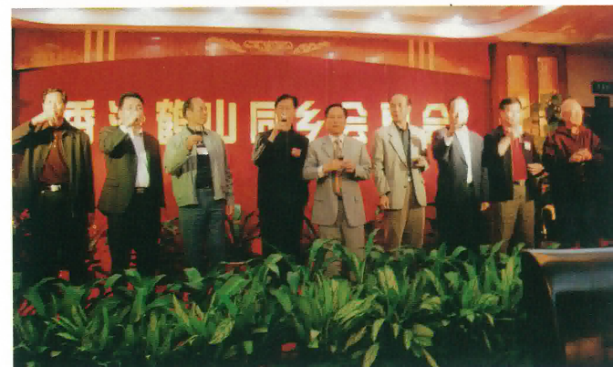
鶴山市領導及香港鶴山同鄉會首長向各會員祝酒