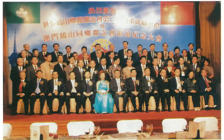
世鶴聯誼會暨澳門同鄉會及嘉賓合照