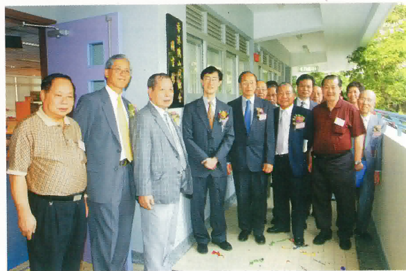
本會理監事參觀教學樓

畢業典禮於下午三時舉行，應屆畢業生有三十三名，本年度升中成績理想，有78%的小六生能升往區內一級及二級的中學，應屆畢業生共有三十三人。整體學生更在體藝項目上取得良好的成績，包括全港校際朗誦節普通話獨誦亞軍、全港學