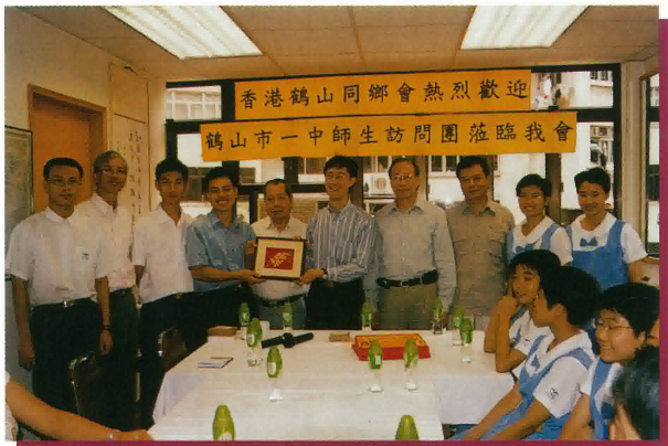
鶴山市一中師生訪問團與本會首長合照