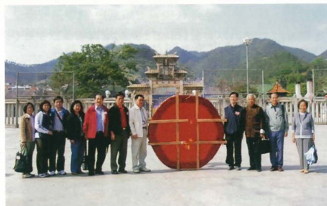
龍母廟主持，外事僑務局局長、同鄉會理事長等與萬丈禮炮合照