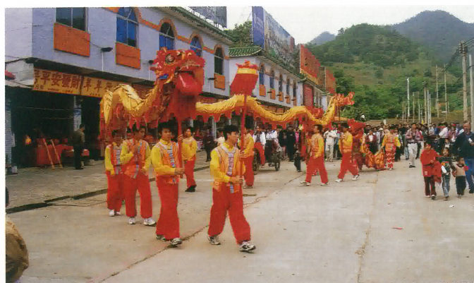
龍母廟舞龍歡迎本會會員