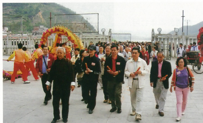
龍母廟主持帶領同鄉會首長及會員上香