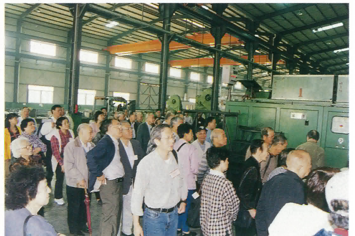
會員參觀共和鎮捷仕克汽車配件廠