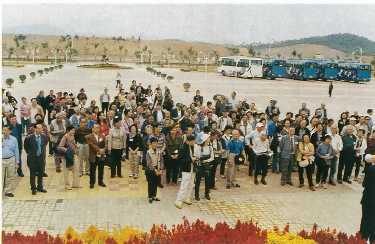
會員參觀台山市新寧中學