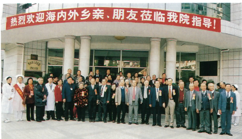
本會理監事等參觀鶴山市人民醫院合照

十八日應古勞鎮政府邀請參加「海外鄉賢懇談會」。五十多名鄉賢歡聚一堂，暢敘鄉情，共謀發展。並參觀了連南學校、僑鄉中學、工業發展區、敬老院、雅圖仕印刷有限公司等，使我們看到今日的古勞，經濟蒸蒸日上，人民安居樂業，各項事業欣欣向榮。