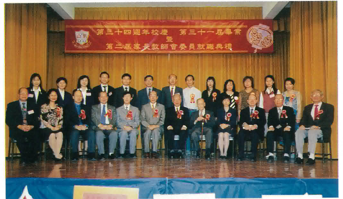
第二屆家長教師會全體委員與嘉賓合照