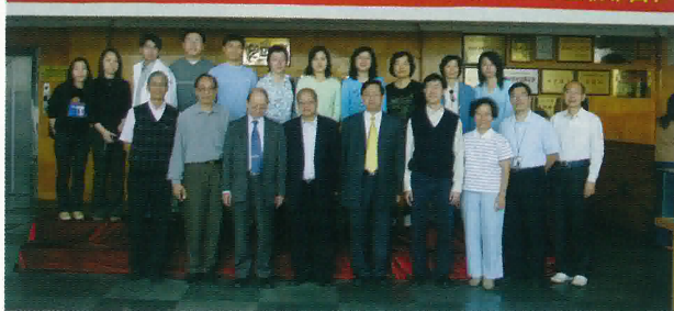
热烈欢迎香港鶴山同乡会理事、香港鶴山學校教師蒞臨雅園社

午飯過後，就是當天重點項目——參觀當地的中、小學。我們先後拜訪了鶴華中學和鶴山市第一中學。兩所中學的規模，真讓我大開眼界，單是學校佔地的面積，已經大大超過了香港有規模的中學的幾倍。教學樓、操場，以至其他特別室的設施，應有盡有。最難忘的是師生們積極投入的態度和濃厚的學習氣氛。校園裡無論是壁報的內容、走廊的擺設等……所展露出來的，都具有濃郁的校園文化。