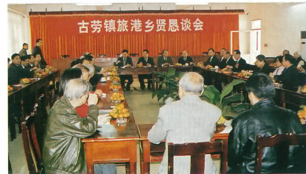
古勞鎮旅港鄉賢懇談會