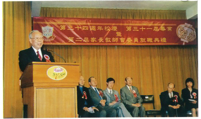
主禮嘉賓李紹鴻教授致訓詞