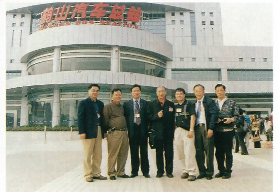
參觀鶴山市汽車總站留念