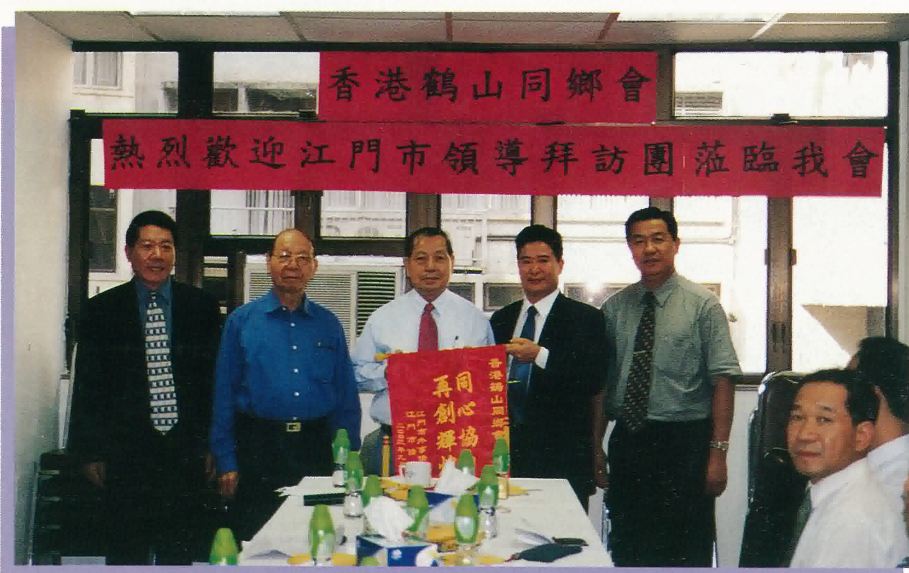
江門市領導到本會訪問

本會下半年共有五十多人入會，不斷壯大了本會組織，其中有來自香港各大專院校鶴山籍的優秀青年學生。