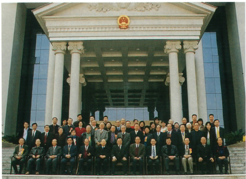
本會理監事與古勞鎮政府領導合照