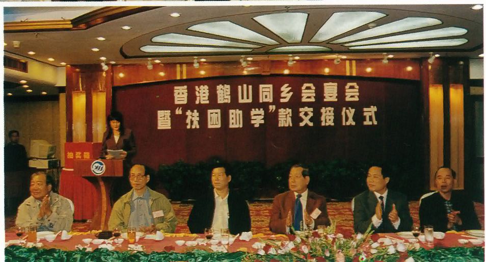
本會首長與鶴山市領導在“扶困助學”款交接儀式