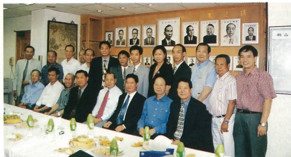
江門市外事務拜訪團與本會理監事合照