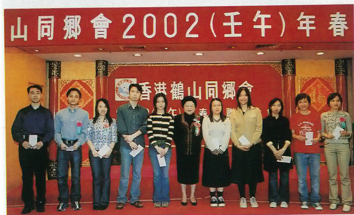
優秀大學及大專生