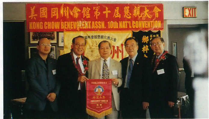
美國岡州會館向本會團員致送紀念錦旗

會議結束後，我團分別拜會了鶴山公所，崇山會館及崇正會館。所到之處，處處充滿歡欣雀躍、愛國愛鄉、熱烈歡迎的濃厚氣氛。據知崇山會館是鶴山人士之會館，崇正會館是全國客籍人士之會館。鶴山公所鄰近街道設立了五邑各地同鄉會，宗親會等會所。