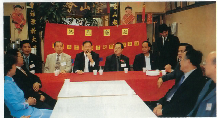
美國紐約崇山會館李書記向鄉親匯報家鄉情況

會議結束後，我團分別拜會了鶴山公所，崇山會館及崇正會館。所到之處，處處充滿歡欣雀躍、愛國愛鄉、熱烈歡迎的濃厚氣氛。據知崇山會館是鶴山人士之會館，崇正會館是全國客籍人士之會館。鶴山公所鄰近街道設立了五邑各地同鄉會，宗親會等會所。