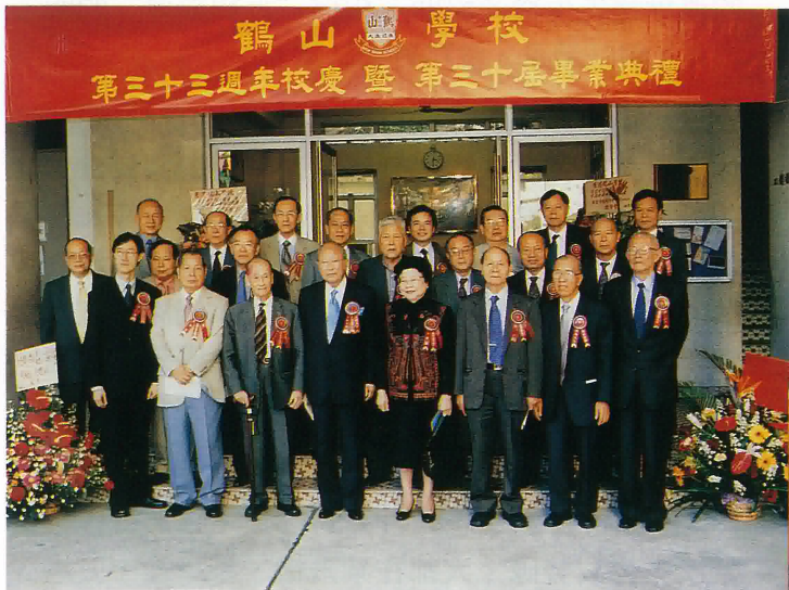
鶴山學校校董、校長及嘉賓合照

一年一度的校慶暨畢業禮，不單是一個值得慶賀的日子，亦是一個讓我們表現的機會，表現教師團結合作的精神；表現同學守規受教的良好態度。鶴山學校給我的印象是一所既充滿親切感，又洋溢著活力與朝氣的學校。一個大型的慶典過後，我們應展望將來，全力以赴、用心教學，來年的校慶必定有更多值得我們慶賀的事情。