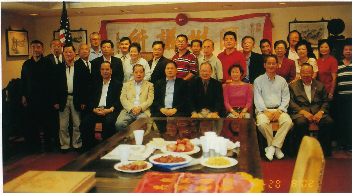
全體訪問團員 與三藩市岡州總會館 部份領導合照

8月27日我團乘機飛往拉斯維加斯。因美國9.11事件後，乘機者均需提前3小時抵達機場接受嚴密檢查，承蒙劉志明先生熱情幫助辦理登機手續，我們才順利登機，並於當晚九時抵達拉斯維加斯。美雅集團公司派駐羅省辦事處的尹明總經理熱情周到地款待了我團，還陪同我們觀賞拉斯維加斯夜景，欣賞世界最大的音樂噴泉及人造威尼斯。提及人造威尼斯，它神奇的建造特色令人目不暇接，流連忘返。晨曦、中午、晚霞的天空相映成趣，廣闊至極。我想若有幸再到拉斯維加斯，我定要小住數天，再次觀賞其建築特色，細細品味當中無窮的樂趣與韻味！