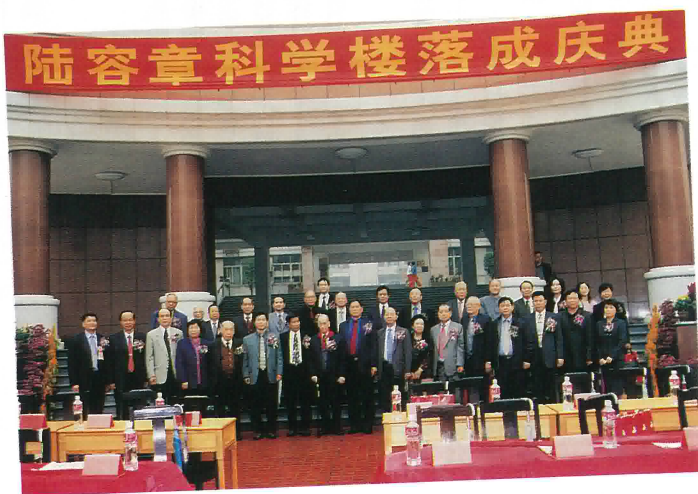
陸容章科學樓落成慶典