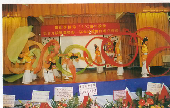
學校舞蹈組表演東方舞