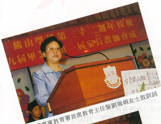
主禮嘉賓教育署首席教育主任黎劉瑞娟女士致訓詞