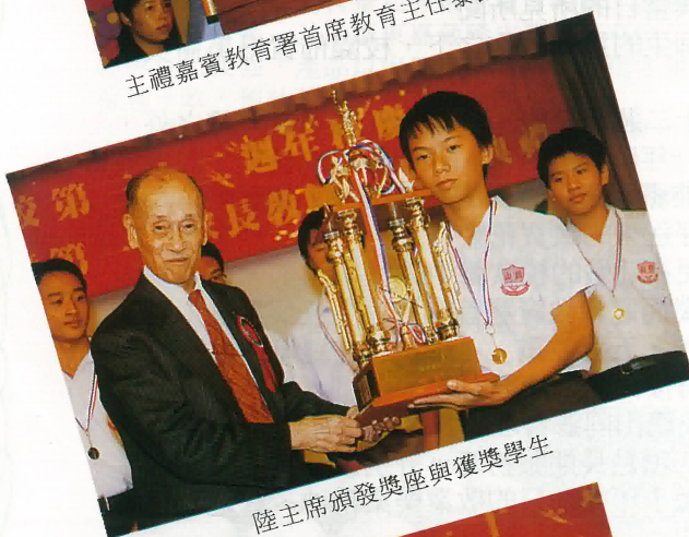
陸主席頒發獎座與獲獎學生