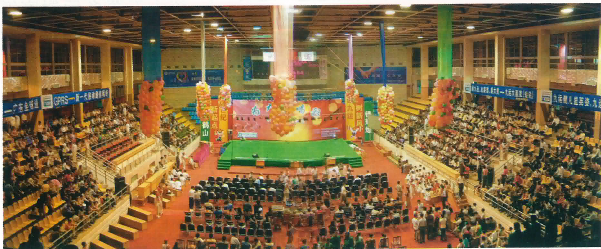
鶴山體育館裝修一新，第九屆全運會舉重在此舉行