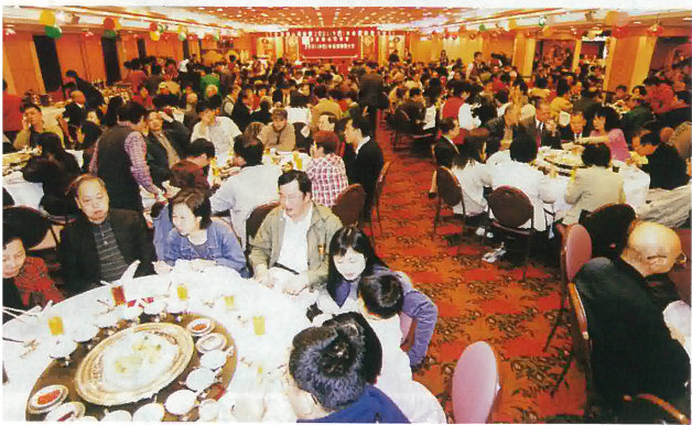
年聯歡大會來自各地嘉賓、鄉親宴會一片熱鬧場面