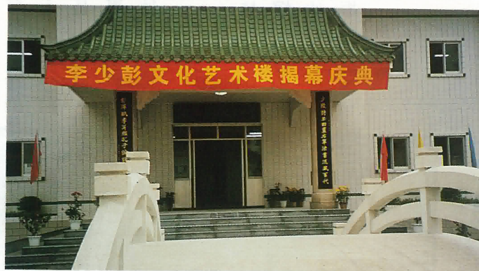
李少彭文化藝術樓舉行揭幕儀式