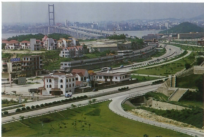
九江大橋入口兩條高速公路進入鶴山小洋房拔地而起