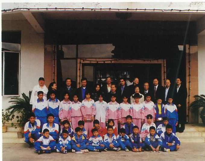
扶貧助學訪問組到址山鎮與受資助學生合影留念