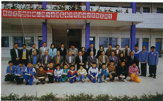
扶貧助學訪問組到古勞鎮與受資助學生合影留念