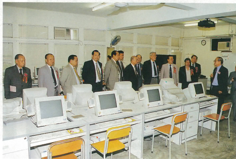
鶴山同鄉會理監事參觀學校電腦室