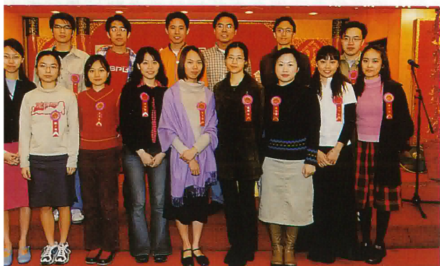
會服務之青年組合影留今