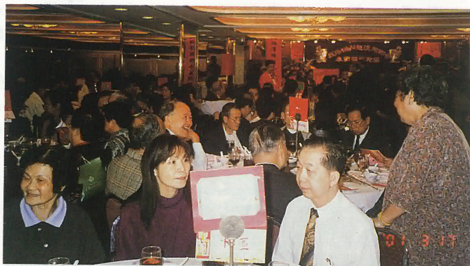
龍溪同鄉會聯歡大會會場熱鬧場面