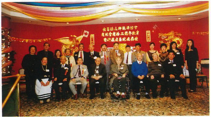
安省鶴山鄉親聯誼會十二週年合影留念