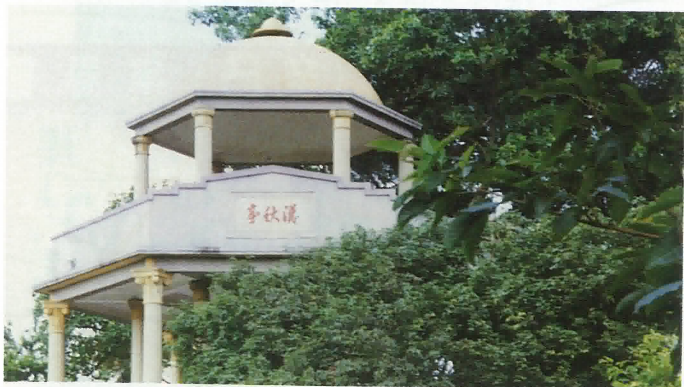
建於一九三八年鶴山市雅瑤鎮黃洞村之“漢秋亭”