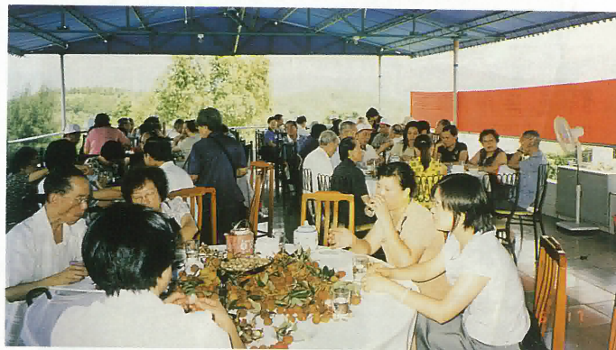
今年回鄉啖荔於鶴城鎮祥興農莊品嚐優質荔枝