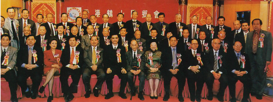
每內外嘉賓與本會理監事合影留念