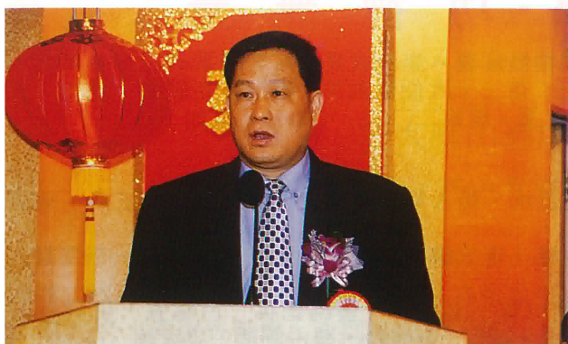
市委書記李澄海向大會致辭