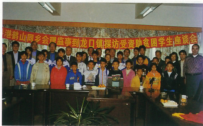
扶貧助學訪問組到龍口鎮與受資助學生合影留念