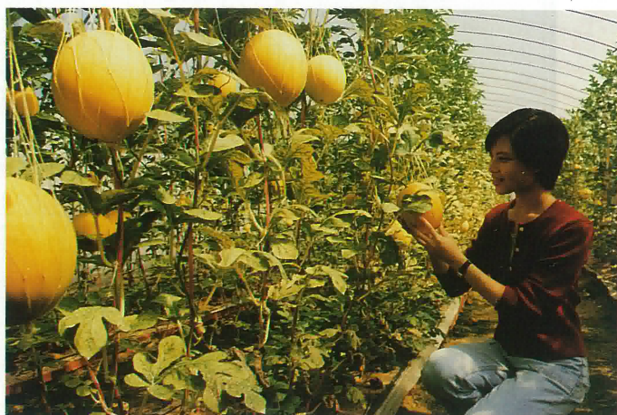
這是“西瓜”優良品種，技術員正進行品質優選