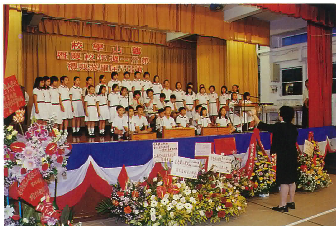
本校歌詠組同學為大會表演歌曲