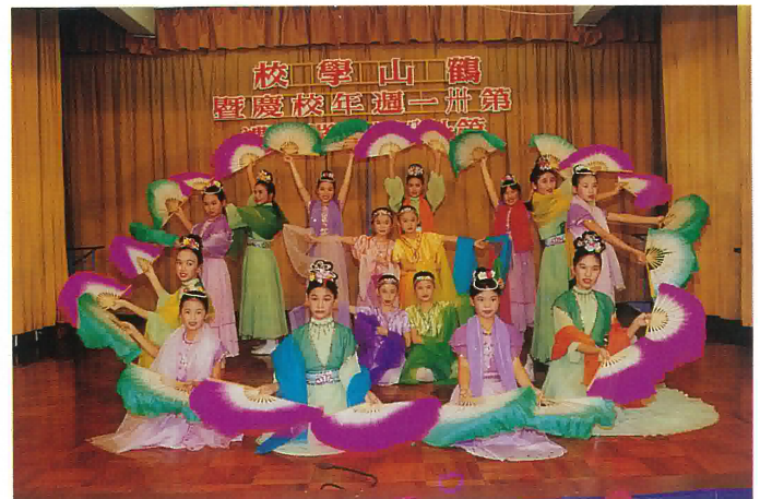
本校歌舞組同學為大會表演舞蹈