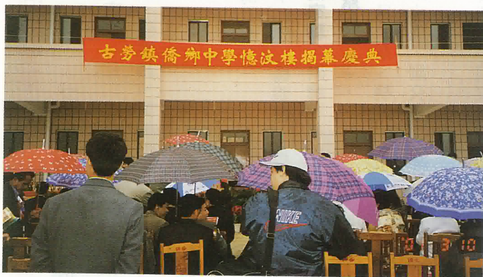
古勞僑鄉中學憶汶樓舉行揭幕儀式