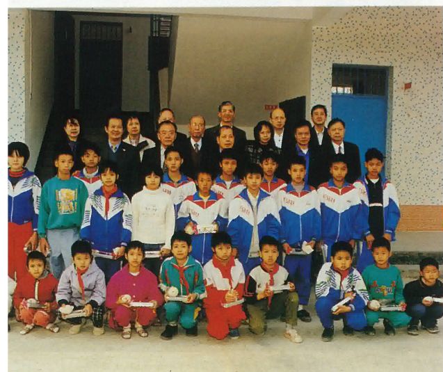
助學訪問組到桃源鎮與受資助學生合影留念