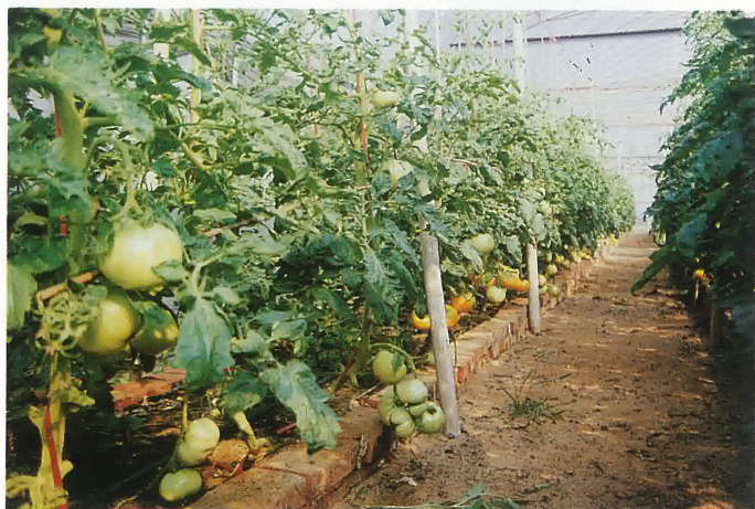
雅瑤農業生日新月異這是高產蕃茄基地