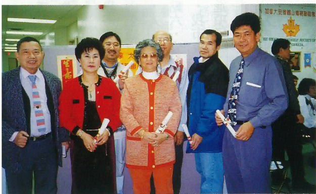
加拿大安省現屆常委合影留念

一九九八年及一九九九年，進一步健全和制訂各種規章制度，為穩定經濟來源由任財福會長特力籌集資金，得到眾多鄉親支持，基本上有穩定收入，本會雖然一波三折，艱苦共渡困難，今要繼續努力，團結廣大鄉親，不斷壯大集體組織，在新世紀中，爭取有更好成績。