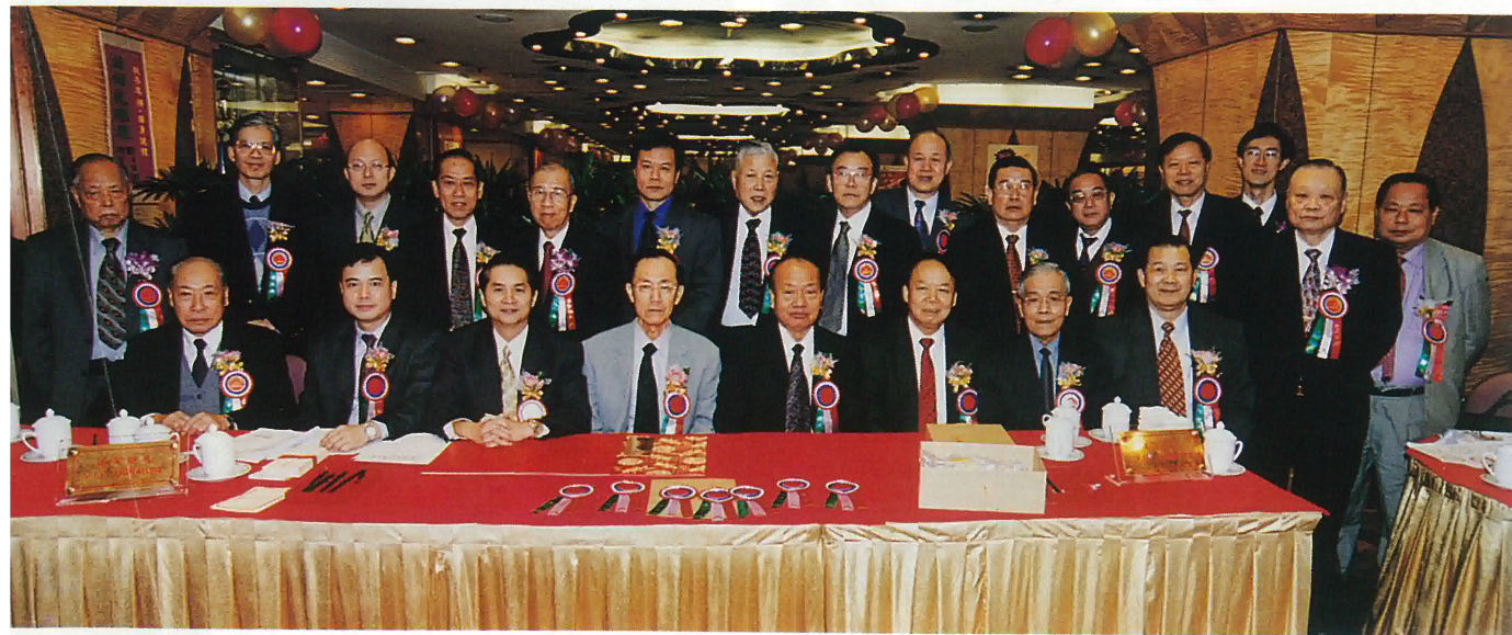
會理監事及工作人員為大會服務之台前合影留念

此外，還舉行幸運抽獎，共有一百一十三項，為大會增色生輝，大會在一片喜氣洋洋的歡樂聲中結束。