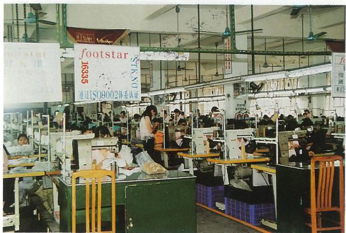
雅瑤增兆鞋廠生產車間一角