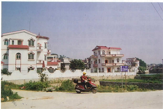
雅瑤農村住房新面貌出入交通摩托代步

站。電網改造二百五十多公里。全鎮供電網絡和用電量除沙坪城區外，雅瑤是在各鎮之首。為了改變投資環境，政府轉變職能，由原來包攬一切現改變到投資軟硬環境方面上來，並提出服務也是生產力的觀點。近年來，共投資二千五百多萬元修築了四十多公里鎮通村道硬化建設。“八五”期間每一百平方公里的公路密度是十二點一公里，如今已增至六十四點三公里。還投資了二百多萬元接通雅瑤至沙坪自來水公司，使雅瑤的水、電、路功能樣樣齊全，交通方便，網絡交錯，是塊投資的熱土。