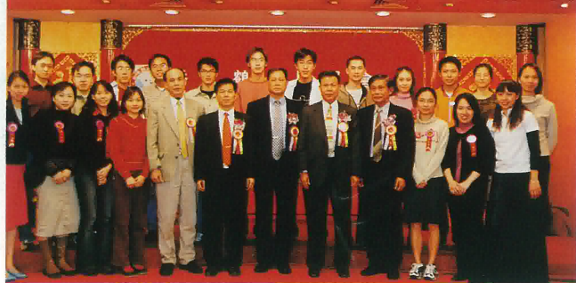
為大會服務之“青年組”與鶴山首長合影留念