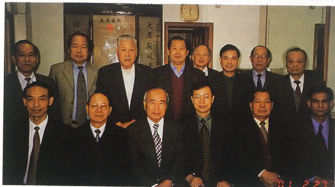
江門市副市長司徒捷等前來本會拜訪時合影留念