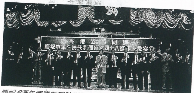
慶祝48週年國慶新華社副社長鄭國雄等首長向大會祝酒。