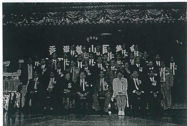
一九九七年(丁丑)春節聯歡大會理監事同人與嘉賓合照。