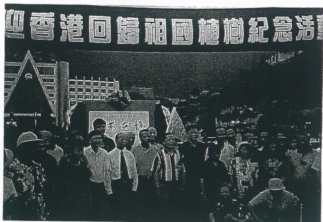
慶祝香港回歸祖國植樹紀念活動鶴山市領導和團友合照。