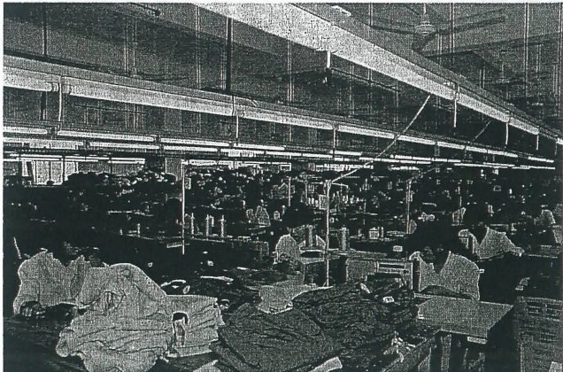
龍口服裝廠生產車間一角。

六十多萬圓，搞好交通、通訊、能源建設及市政建設；江肇線一級水泥路貫全鎮，通向各管理區的七米水泥路已全部實現；鎮區至鶴山港十公里，當天可往返香港；電源十分充足，鶴山市新建的二十二萬伏變電站建在龍口鎮側的木棉崗上；程控電話，圖文傳真的通訊設備在一九九三年也已全部開通；一九九二年擴建了自來水廠，可供城鎮工商業和一萬人生活和生產用水。教育事業和文化福利事業發展迅速，從一九八四年至一九九四年全鎮投入辦教育醫療資金達二千六百多萬圓，新建小學十八所，中學兩所，幼兒園三十多所，醫院兩間，并增加大批教學設備和設施。一九九三年被廣東省評為校舍改建先進單位和一九九六年被江門市評為鎮級甲級醫院。 現在，龍口鎮有日臻完善的投資環境，有眾多的各類技術和管理人才，有素質良好的勞力。龍口這塊寶地充滿生機、充滿發展、充滿希望，他將會建設成爲文明富裕的新僑鄉。