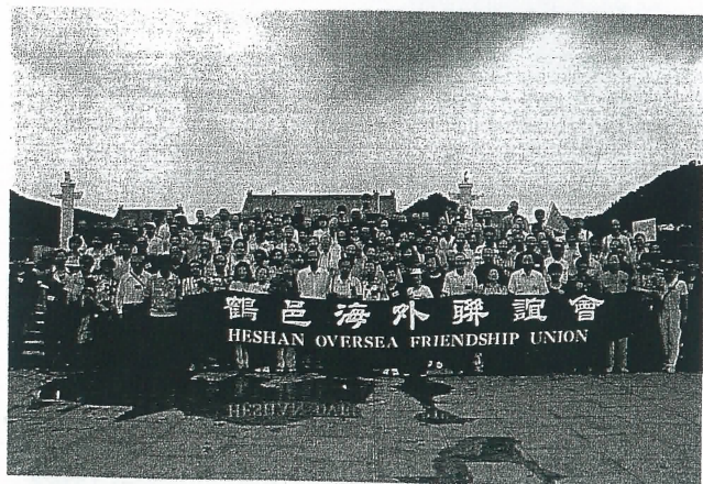
回鄉觀光團途經珠海參觀圓明新園時合影。

誠然，這項旅遊活動，既大飽口福、眼福、又增廣見聞，增進感情、鄉情，屬實誠快事也。據鶴邑海外聯誼會透露，今後還將增加和擴大組織旅行團回鄉觀光。