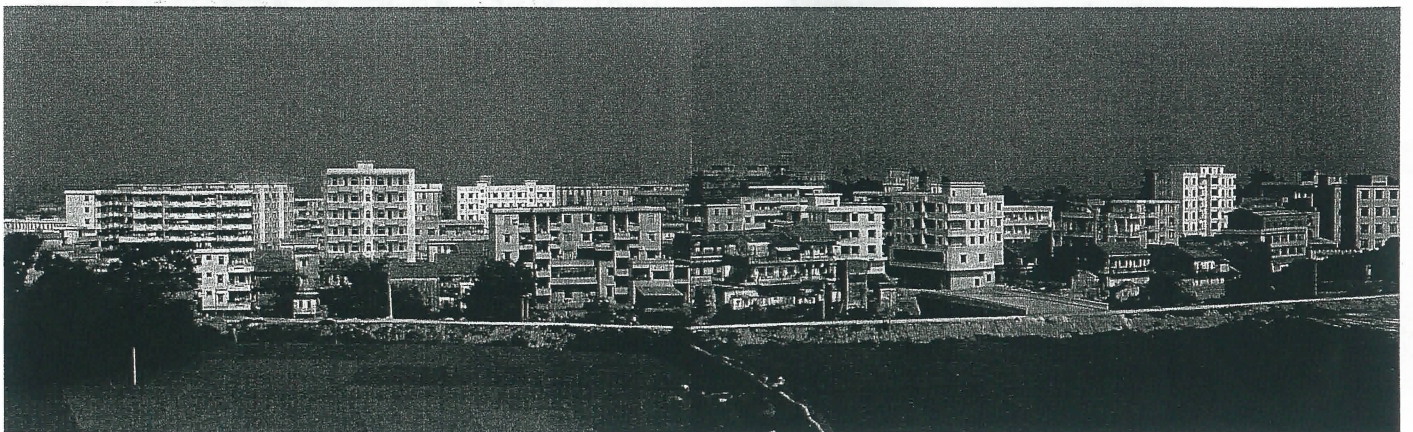
鶴山市龍口鎮外景，春色滿園。