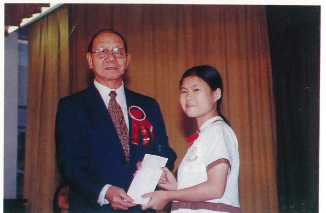
鶴山同鄉會理事長兼校董頒發勵學金。