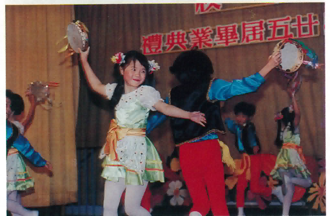
學校舞蹈組表演娛賓。