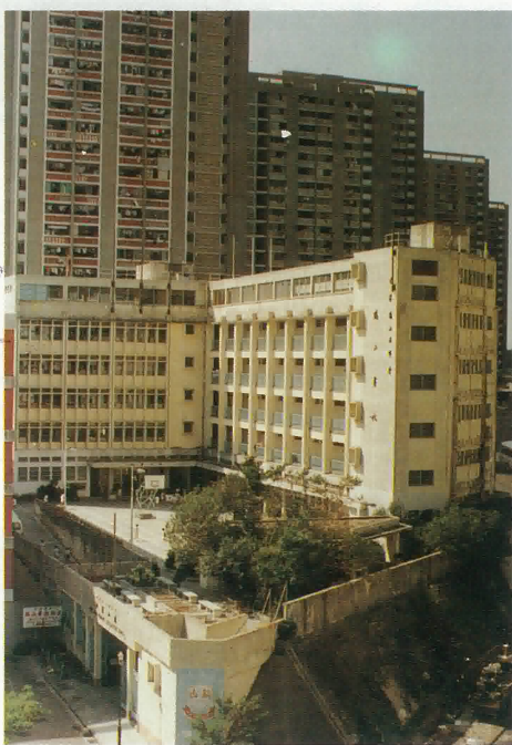
鶴山學校校舍全貌