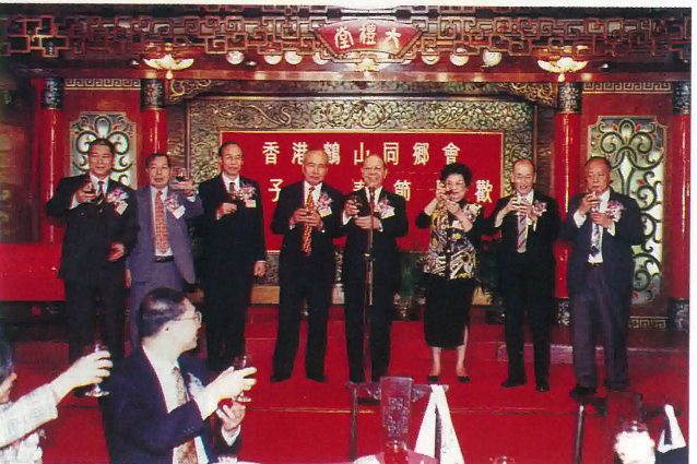
本會首長向嘉賓及鄉親敬酒。