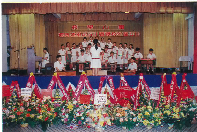
學校歌詠隊表演娛賓。