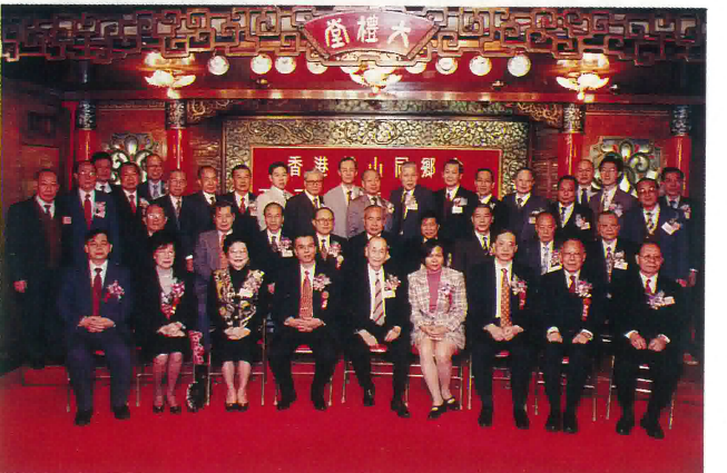
一九九六年（丙子）春節聯歡大會理監事同人與嘉賓合照。