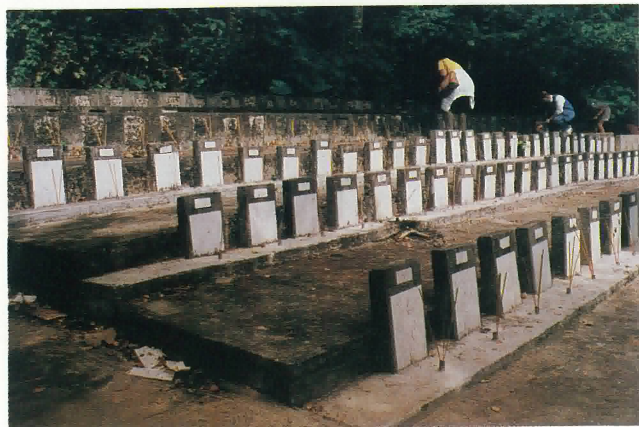
沙嶺「鶴山先友義塚」墓地(左邊)碑石。