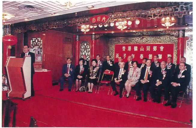
嘉賓鶴山市委書記鄧啓明先生致詞。