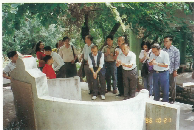
本會理監事同人向鶴山先友義塚拜祭。