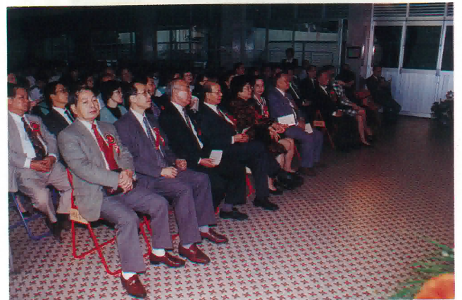
嘉賓歡聚一堂，欣賞歌舞表演。