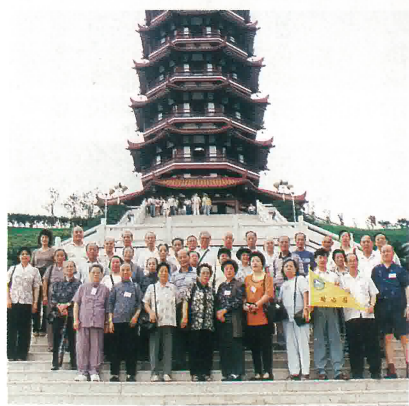
鶴山海外聯誼會舉辦“96旅遊啖荔團”團友在大雁山紀元塔下合照。

六月廿二日，啖荔團來到鶴山宅梧鎮，那裡有遠近聞名的荔枝園，以種植優良品種「妃子笑」，具有皮薄、核細、清甜、多汁之特點，個個團友親手摘下之新鮮荔枝，品嚐飽腹，果味極佳，人人讚口不絕；臨走前，每人還帶回一袋荔枝，以便回港分給親友品嚐家鄉風味。這種活動，既增加見聞，又能大飽口福，屬實增益良多，誠快事也。明年還將繼續組團進行這項旅遊活動。