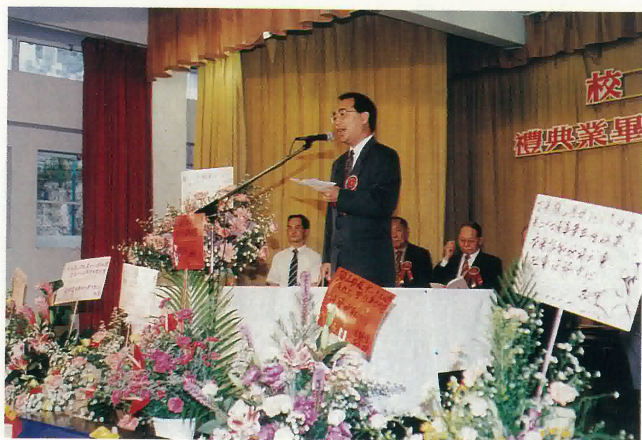
羅英才高級教育主任致訓詞