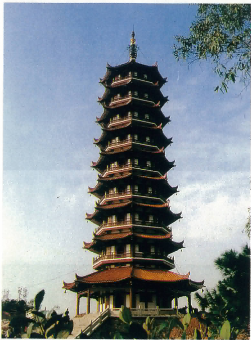
鶴山市大雁山新建落成紀元塔