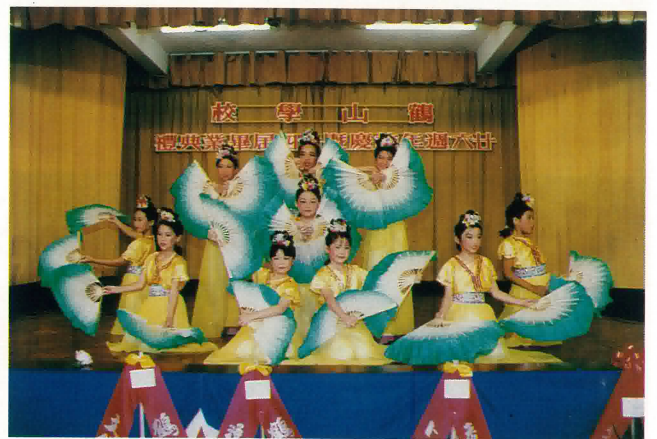
學校舞蹈組同學表演娛賓