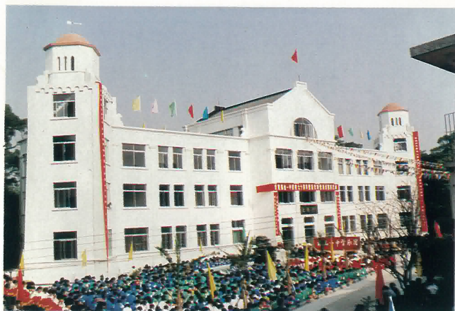
鶴山一中重建新「坎僑堂」外貌。

當晚，一中還特意邀請部份市領導、僑胞、港澳同胞及校友代表等參加聚餐，舉杯共祝鶴山一中美好的未來，在歡樂氣氛中結束。