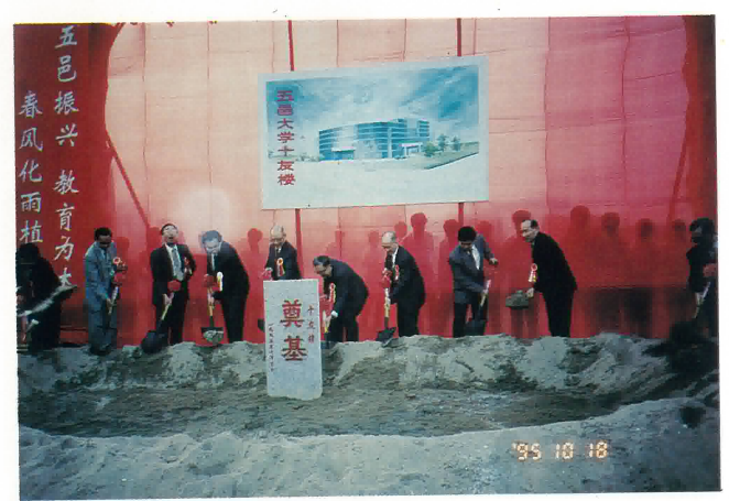
江門五邑大學“十友樓”奠基典禮。