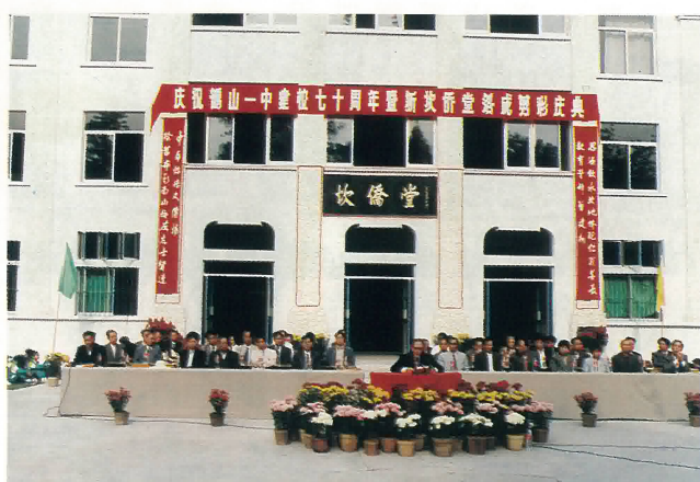
鶴山一中七十週年校慶暨新「坎僑堂」落成剪綵慶典。