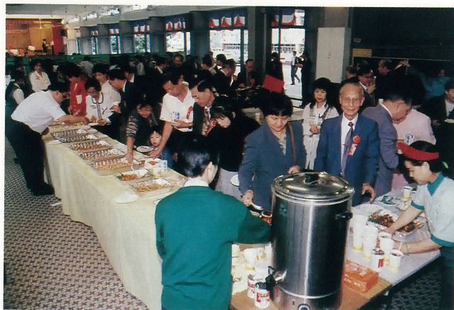
典禮前茶會熱鬧場面