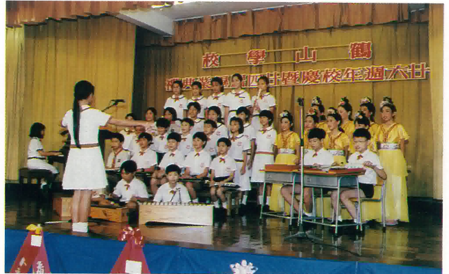
學校歌詠組同學表演娛賓