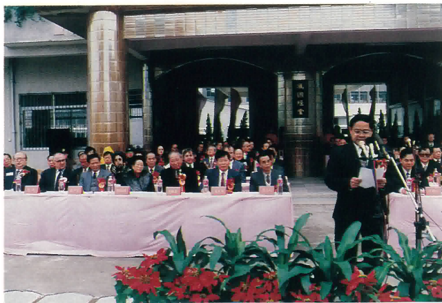
鶴山職業中學馮漢柱科學樓，馮李佩瑤花園和馮擢卿體育中心三項剪綵香港貿易發展局主席馮國經先生講話。