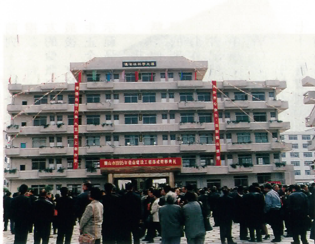
鶴山職業高級中學馮漢柱科學大樓。