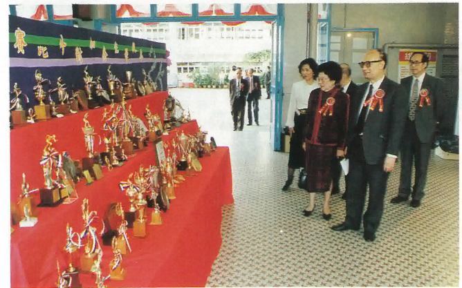
嘉賓欣賞學生獲獎獎座。