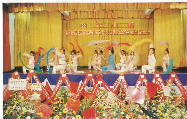
學校舞蹈組表演娛賓