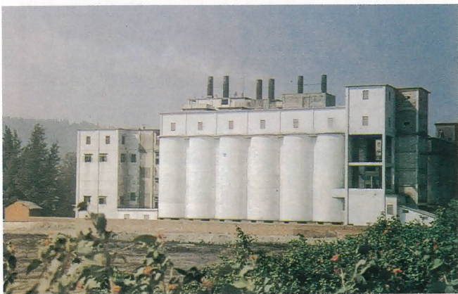
鶴山沙坪水泥廠第二生產線

鐵塔上端安裝立體聲調頻廣播及電視發射天線，發送鶴山廣播電台和電視台播出的節目及有線電視台與各鎮聯網的微波信號。鐵塔中端是無線電通訊轉發基地。塔中間五十二米高設有可容一百遊人的敞開和封閉的觀光台各一個，遊人可乘電梯也可沿步梯拾級而上，登高遠眺，飽覽珠江三角洲田園秀色。塔座分兩層，共一千一百平方米，可供遊人在此娛樂、休憩和就餐。