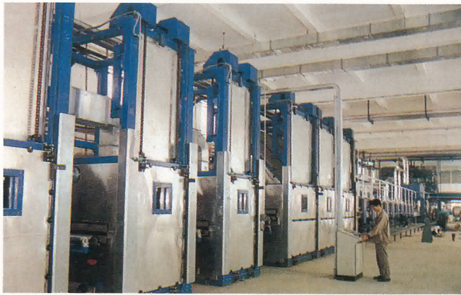
海山集團氨綸生產線

氨綸是一種合成彈性纖維長絲，除了一般合成纖維的耐化學藥品，不怕蟲蛀，不怕霉等特性外，還具有較好的伸縮性，彈性和回彈彈性，並有較好的熱老化性能，染色性能和紡織工藝性能，可廣泛用於織造各種彈性織物，如針織內衣褲、運動服、泳衣、體操服、襪、腰帶、鬆緊帶、彈性繃帶及醫療手術縫紉帶，降落傘等。