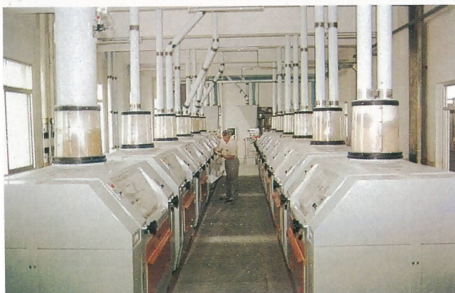
鶴山東坡面粉有限公司生產車間