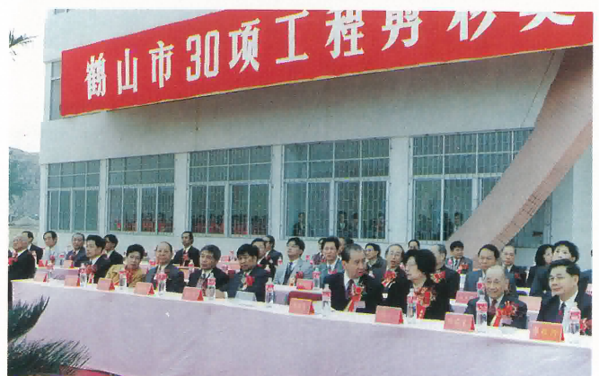
鶴山市30項工程剪綵暨頒授榮譽市民慶典主禮台