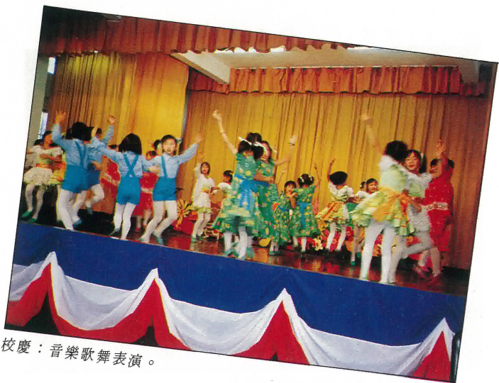
校慶：音樂歌舞表演。