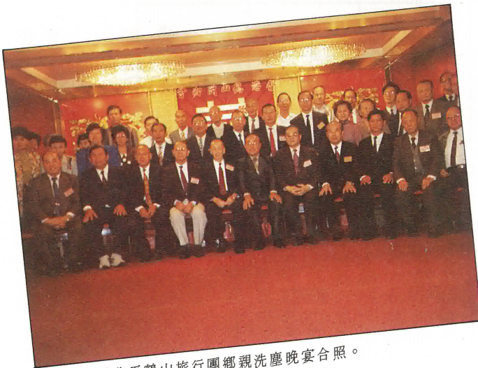
本會同人為北馬鶴山旅行團鄉親洗塵晚宴合照。