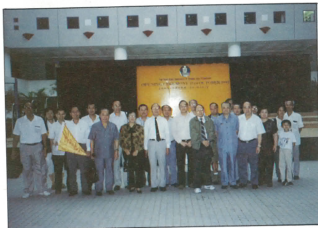
本會同人秋遊參觀香港科技大學合照。