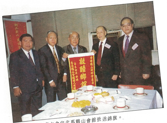
陸容章會長代表本會向北馬鶴山會館致送錦旗。