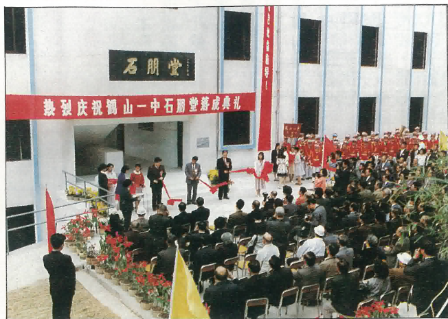
鶴山縣第一中學「石朋堂」落成剪綵典禮。

我縣當局為拓展旅遊業，開發大雁山，不失為明智之建設，本山人勢雄偉，景點甚多，當局有計劃開發，首期工程包括登山公路以連絡各景點，建商場飯店為遊客服務，廣植樹木美化青山，以各景點處築亭台樓閣以供遊人攬勝休息。目前建好之八景有雁山門，半山閣，獅子峯亭，雁山平湖，海元洞，雁峯亭，攬月台，無底潭等。務達風光旖旎，景色怡人之目標，登巔遠眺，西江如銀蛇繞過，阡陌田園間別墅式建築幢幢。證明邑人已達小康境地。當局正推廣次期工程，增設酒店，別墅山莊，及各項遊樂設施，配合不日建成之佛開高速公路。交通更為方便。那時候，雁山攬勝，將是中外賓客旅遊之新天地。