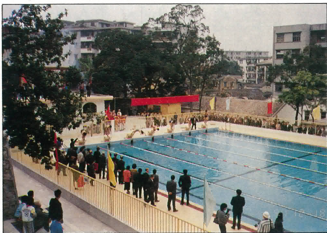
鶴山一中學生在慶典中游泳表演。

游泳池乃邑賢陸容章先生捐建陸佑體育館後續捐資興建。座落陸佑體育館西側，佔地一千一百三十四平方米，附設有能容納五百名觀眾的看台及更衣室，泳池長二十五米，寬十八米，泳道七條，池底及四壁鑲嵌天藍色瓷磚，池水清澈，與四週綠樹紅花相映，更顯得清新秀麗。誠為學子鍛鍊身體之理想場地。