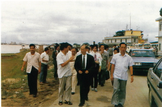
參觀新聞鶴山港工地。