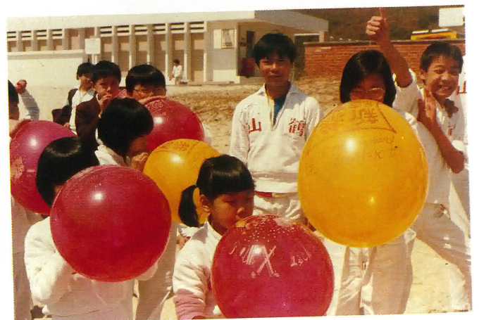
學生旅行遊戲比賽。