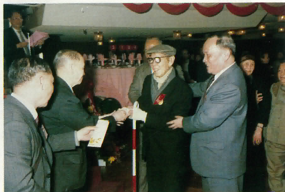
陸容章會長致敬送敬老金牌