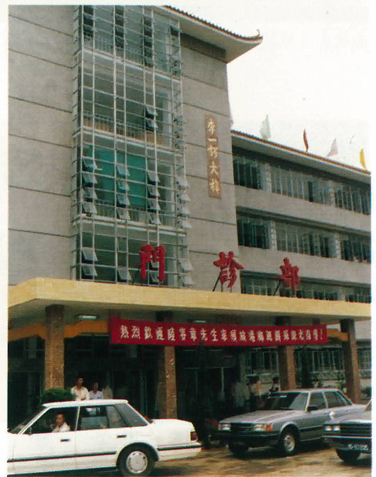
李一諤大樓門診部入口處。