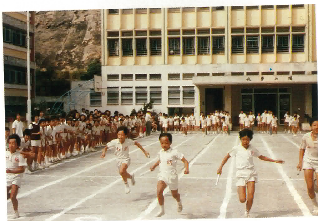
本校學生運動日接力比賽。