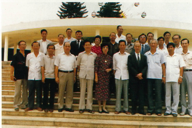
回程參觀江門東湖公園。