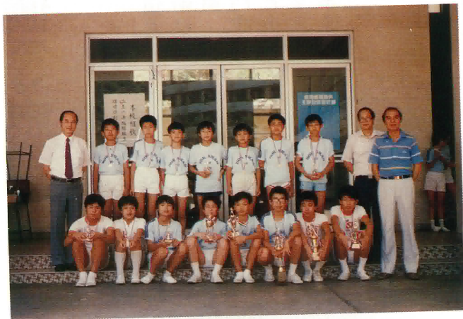
本校乒乓球隊得獎同學合照。

四月二日：全校大旅行。（地點：西貢北潭涌。） 五月份：訓育標語創作比賽。 五月廿一日：數學科比賽。 六月份：圖書閱讀書簽設計比賽。