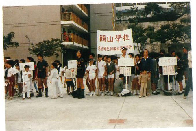
本校學生參加屋邨慈善步行。