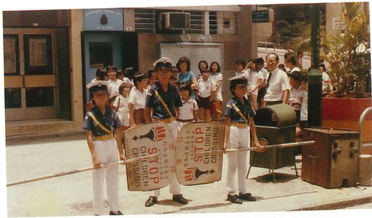
本校交通安全隊維持放學秩序。