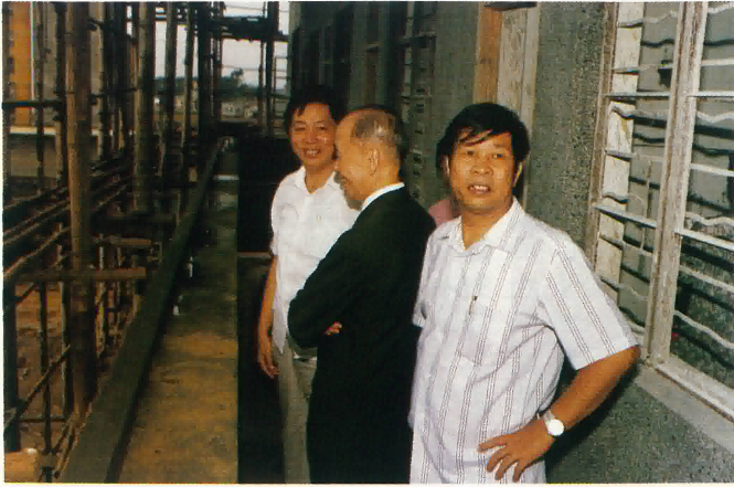
參觀陸佑大樓（住院大樓）內部裝修。