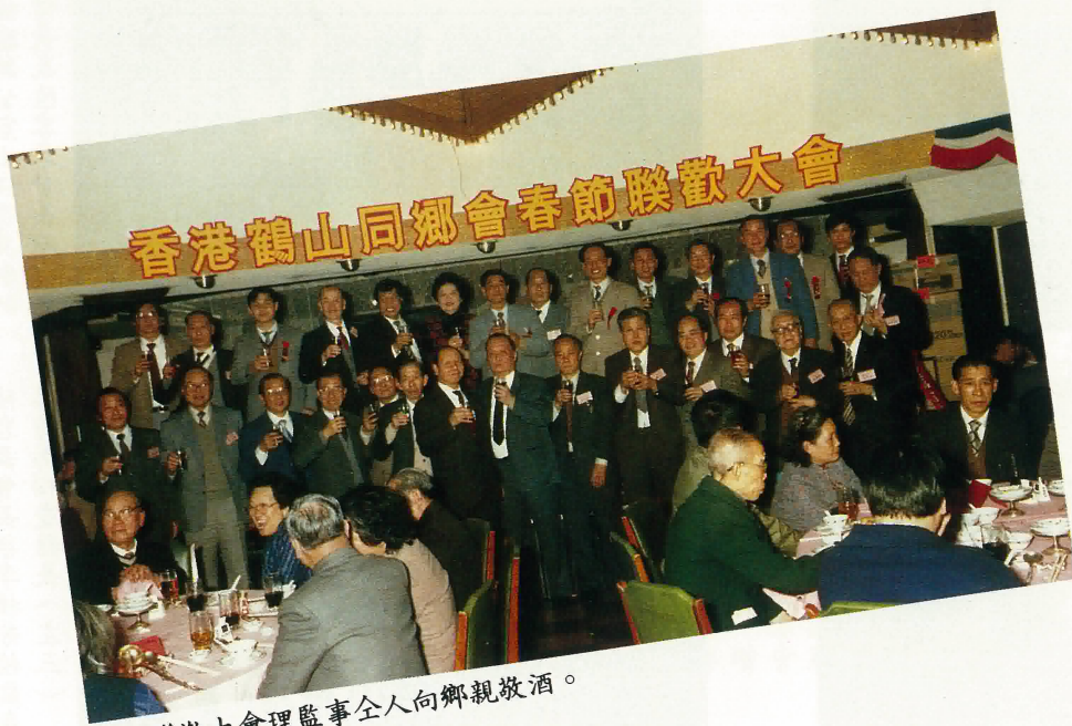
春節聯歡大會理監事全人向鄉親敬酒。