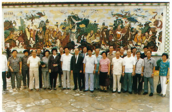
參觀沙坪南山公園。