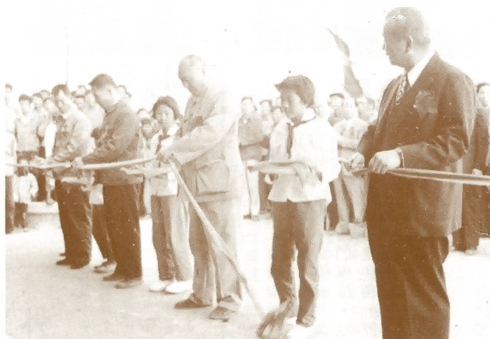
崑東學校新校舍開幕剪綵情形

崑東的教育，在過去四十年為全縣最高水平的，但今天怎樣呢？據我今年九月返沙坪，由一中張副校長處得知今年一中入學試的各地成績，本校是空白的，遠遠落在古勞，陳山等校之後，於此，我盼望全校的老師們，今後要多下些工夫，蓋小學教育，首重愛心與責任心，功課之餘，還須時刻關心學生的學習情緒，至操行的訓練，師長應以身作則，盡責輔導才有所成。如果教完（即上完課）就完，肯定成績好極有限，同學們固應努力，而家長們在家，也應加強管教，庶幾學校與家庭合力則管教始能事半功倍，須知小學的基礎好，將來入中學或大學，才有機會啊！此外先屆畢業同學，也應盡力幫忙母校解決困難，如教學上的應用文儀，圖表，體育上的設備等等，如何使之無有或缺，亦為同學應盡之一點責任，務要大家同心協力把崑東學校辦成一間出色的學校，使之晉入重點學校，從而把本縣文化水平提高，亦即為四化培育人材對國家作出貢獻。是所厚望了。