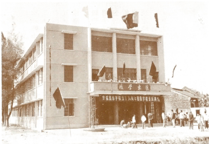
崑東學校新校舍（內有五百呎課室八十個）

學校經過九個月的工程，經於八一年十一月十一日開幕了，我們選擇今天開幕的原因，原來本校的前身為平岡小學，而平岡小學的前身係平民學校；是日乃五十九年前平民學校開幕的日子，我們選擇了這日子是表示我們追念先賢繼承先志的意思！