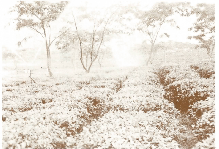
。園茶到春——對川茶場六百多畝茶園實現自流噴灌。

又年初，由馮松慶書記等訪港，在新界嘉道理爵士實驗農場引進了澳洲「銀帶」豬，英國「紅毛」豬，該場培養的「白石」種豬，一共五十頭(其中三十頭為嘉爵士所贈)「良種」三黃雞一千隻，「白鴨」三百隻，在六洞馬山良種場，經過在水庫中央的小山禁區，由中央及省派員前往檢疫觀察之後，已在繁殖中，但亦有不幸的事為「銀帶」一種，患有「毀鼻」症，屢醫無效，並為防其傳染，遭到毀滅外，其他如「紅毛」、「白石」都養育得非尋常之好，已繁殖到第二代，「三黃」雞的成功，的確令人鼓舞，一隻重四至六斤，肉味鮮美，黃咀，黃毛，黃腳，又黃油，現已由一千增到二萬，多出的公雞，通通都剗了，到適當時候，才推展到各公社飼養，至於鴨隻，則以鴨種好，生長快、鴨隻大，肉量高，但可能由於冬早，山溪水不多，水質帶鹹，以至生蛋少、繁殖不快，但現在正設法予以改善云云。