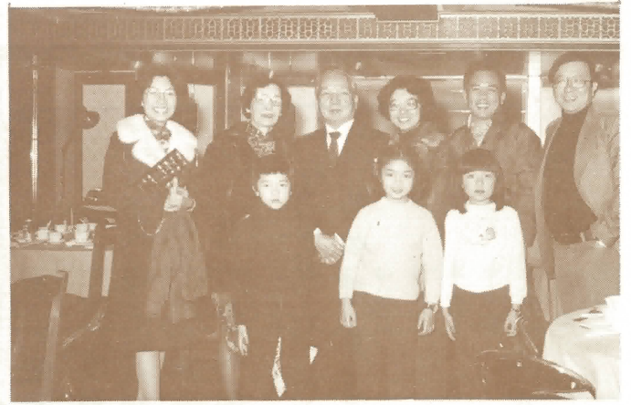
副理事長任其合家同叙歡暢