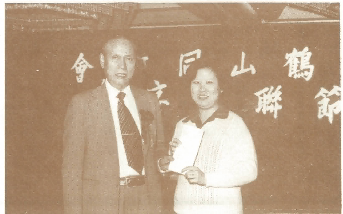
易綺蓮小姐領受旅行獎