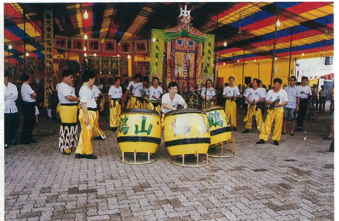
新加坡鶴山會館現場“連環三擊鼓”表演