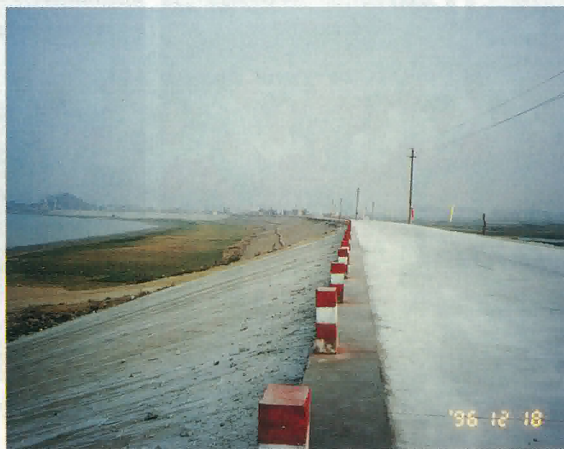
古勞大堤經過多年努力海內外捐資，在古勞政府策劃下勝利建成通車可抗百年一遇大洪水

建、工商管理費上盡鎮的能力給予優惠，確保一系列優惠政策實施產生明顯效應，使外資民資企業有廣闊的發展空間。我們熱誠歡迎外資、民資企業到古勞投資，為實現僑鄉經濟的第二次騰飛而努力！