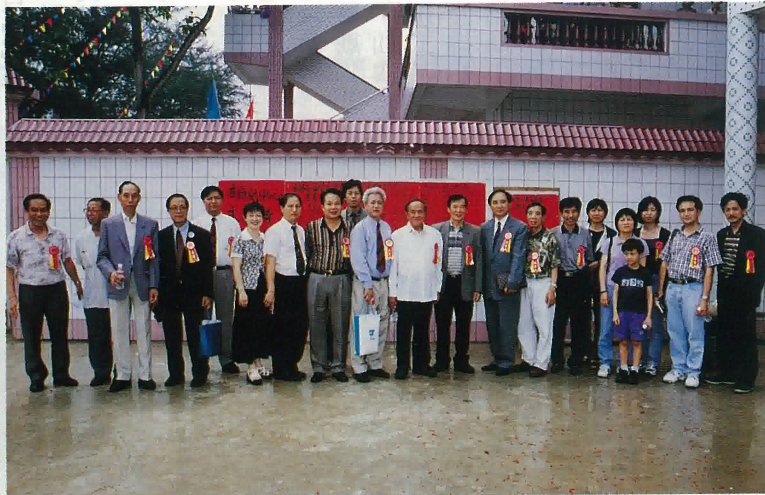
來自香港元朗地區鄉親參加中七幼兒中心落成典禮