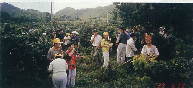
啖荔團的團友正在採摘又香又甜又大的良種荔枝，帶回港品嚐

旅行團結束當晚，在北湖賓館宴會廳舉行晚宴，並進行抽獎活動，演唱會等助慶，歷時三天啖荔旅遊完滿結束，分別乘船回港。