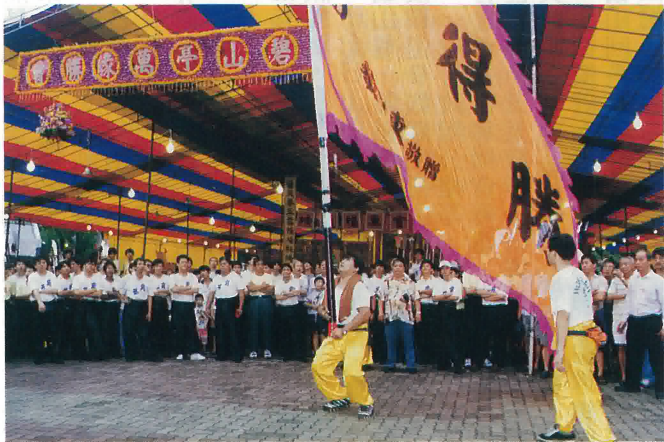
新加坡鶴山會館醒獅團正表演高難度之“大旗表演”現場

有鑒於此，會館目前已積極在展開招募新學員，新會員，希望借此培養一股新生的力量來參與會館的發展，也借此機會讓年青人學習關懷社會，回饋社會，使他們正確的認識表達關懷社會的方式與做法，同時也把他們聯繫起來共同塑造會館邁向二十一世紀的新形象，向祖宗交代。