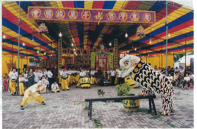
新加坡鶴山會館參加廣惠肇碧山亭萬緣勝會醒獅表演