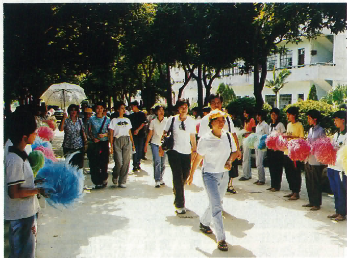
參觀龍口中學教學設施，學生列隊歡迎本港學生