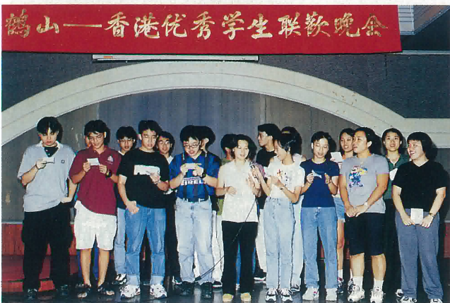
香港、鶴山兩地學生互相交流讀書心得

正所謂「人傑地靈」，鶴山市有着優越的地理形勢。前人的努力和發展，加上年青人累積，加上後人的努力和發展，加上年青人受到良好教育，我相信鶴山的前途是一片光明的，當我長大後有能力的話，我一定會以他們為榜樣，為鶴山供獻自己小小的力量。