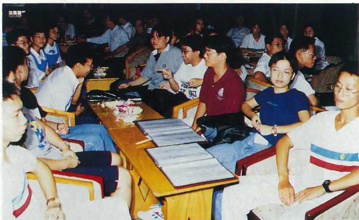
香港、鶴山兩地學生互相交流讀書心得討論會

十七日上午，最後來到江門五邑大學，參觀鶴山樓，陸裕圖書館、十友樓、教學樓等，以及順道參觀鶴山博物館，一中石朋堂、科技樓、一中行政辦公樓等，都是本會對鶴山熱心教育之善長仁翁捐資興建，對造福桑梓，長留後世敬仰。三天旅行，已經完滿結束，這幾天來大飽眼福，大飽口福，增進鄉誼，增廣見聞，人們懷着十分興奮的心情，乘專線巴士離開鶴山回港，這一切，都給全體團友留下美好的回憶。