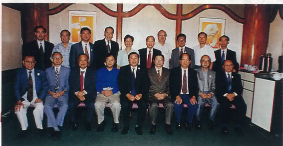
一九九八年九月卅日江門市何羨松副市長在港召開五邑社團座談會