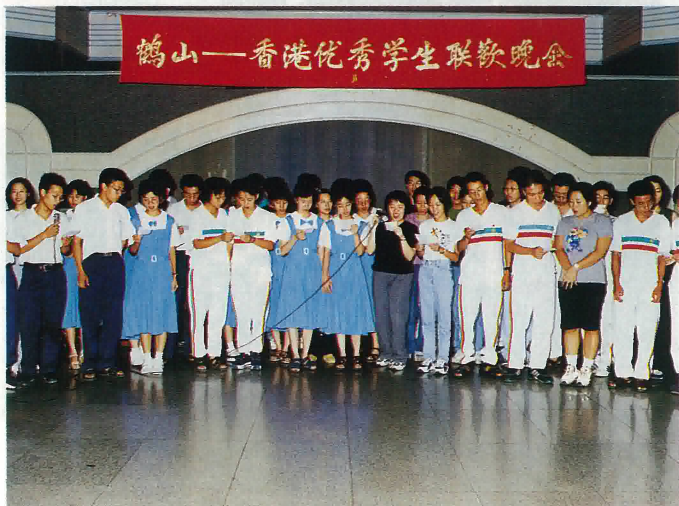
香港、鶴山兩地學生聯合演唱會上