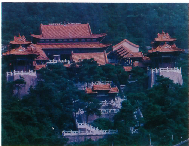
鶴山市大雁山新建海會寺全貌。