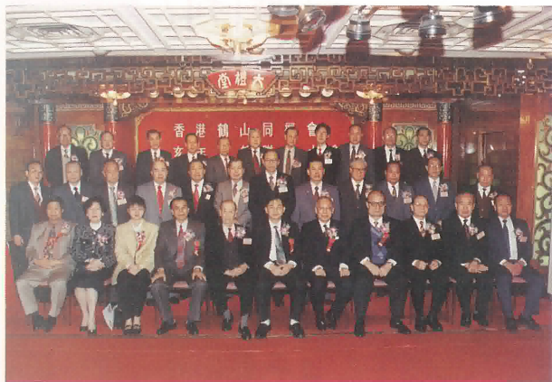
一九九五年(乙亥)春節聯歡大會理監事同人與嘉賓合照。