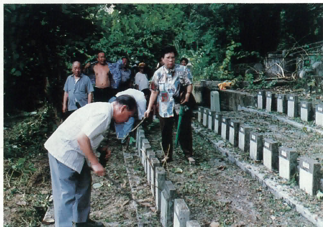
重修沙嶺「鶴山義塚」墓碑墓道。