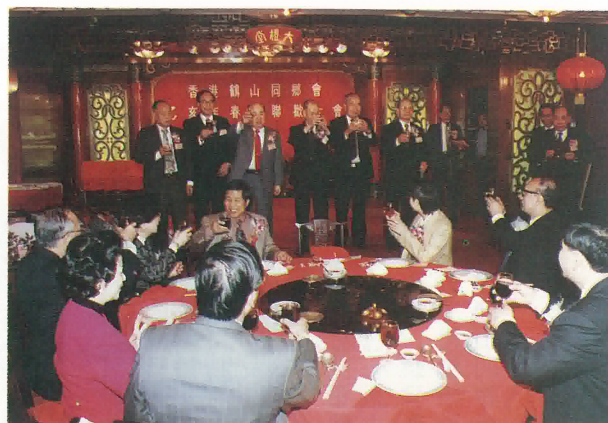
本會首長上台敬酒。