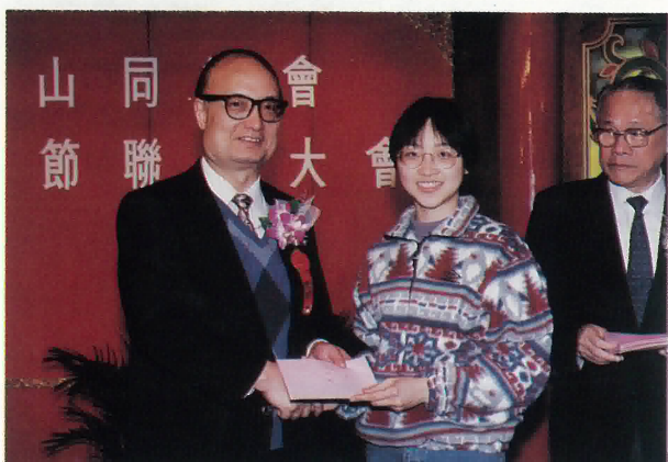
教育署首席教育主任陳永昌博士頒授獎學金。