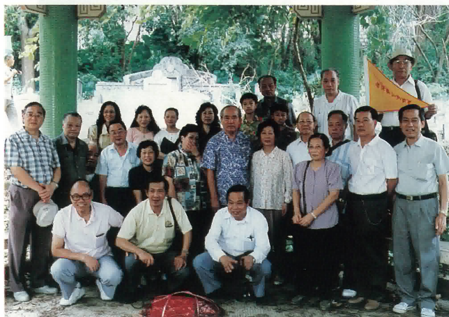
本會理監事及眷屬重九秋祭合照。