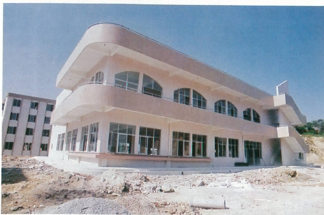
紀元中學香港鶴山同鄉會歷屆理監事捐建大樓（正面）。