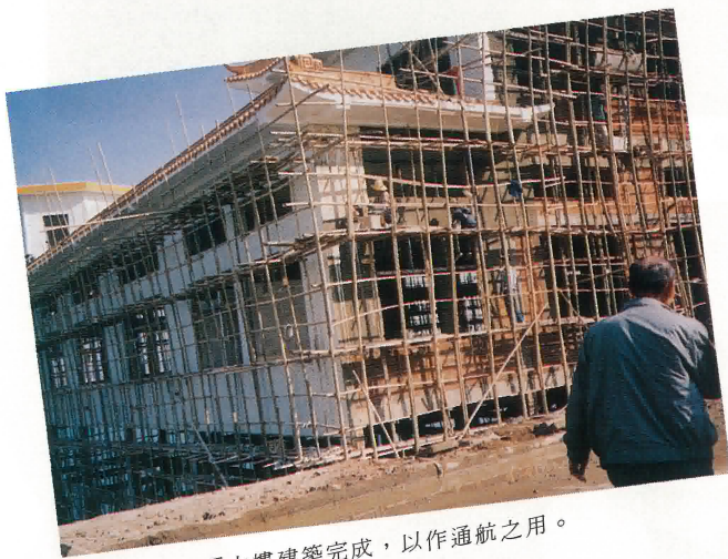
“鶴山港”客運大樓建築完成，以作通航之用。