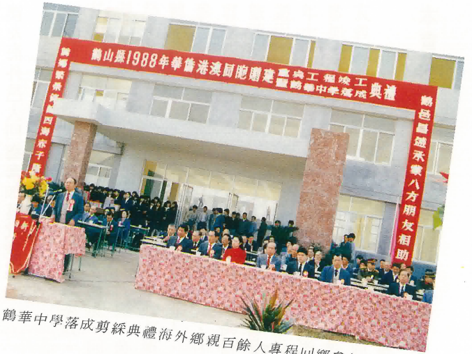
鶴華中學落成剪綵典禮海外鄉親百餘人專程回鄉參加慶典。