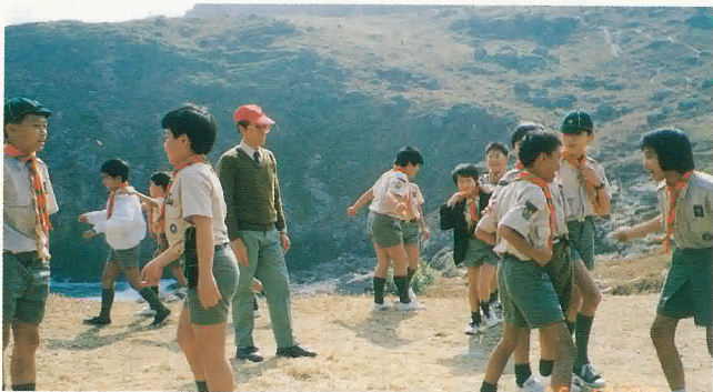
東龍島童軍遊戲活動。