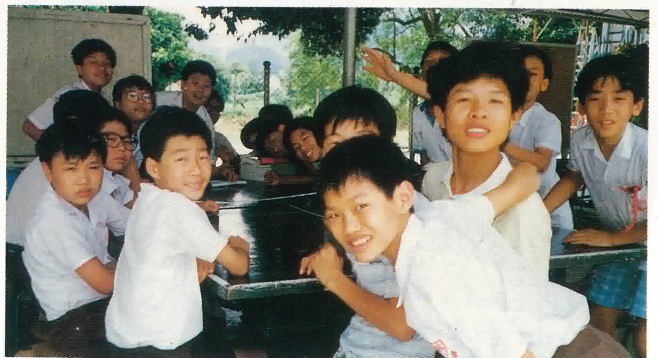
宣道園宿營：小組研討會。