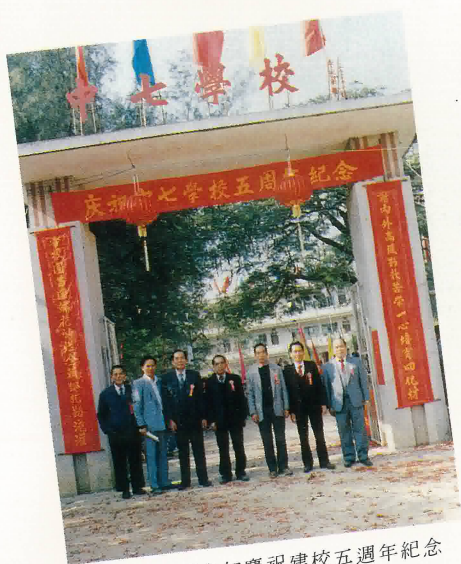
中七旅外鄉親參加慶祝建校五週年紀念校門前合照。

(七)中七鄉中七學校第五週年校慶盛況 我縣龍口鎮中七鄉中七學校，於一九八八年十二月廿六日為建校五週年紀念慶典，到校祝賀有江門市委政協主席李立峰，江門市文化局局長李炎輝等、鶴山縣書記馮松慶、縣長鄒啟鴻、副縣長施寶玉、縣常委胡其盛、統戰部部長馮超林、僑務辦副主任馮偉長、宋超，教育局局長李仕明、人民醫院大醫師李英偉及縣、鎮各單位等蒞臨參加慶典、旅港鄉親李永新、李澤裕等四十餘人回鄉參加校慶，場面十分熱鬧，在當晚起邀請江門市粵劇團主演大戲三晚，每晚來自鄰近各鄉村到場觀看者約三千餘人，該劇團演出受到觀眾大贊好評云。