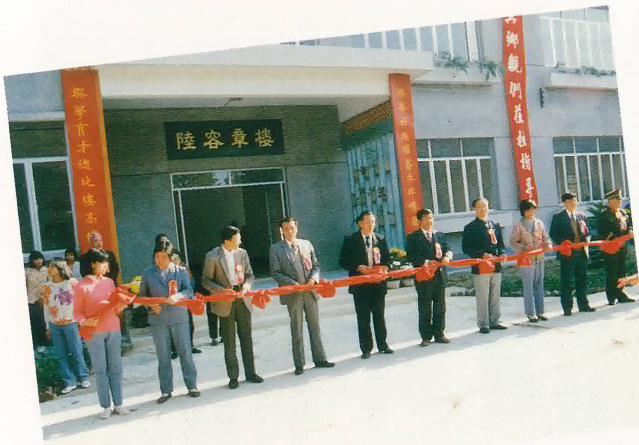
鶴山縣第一中學新建教學大樓落成剪綵典禮。