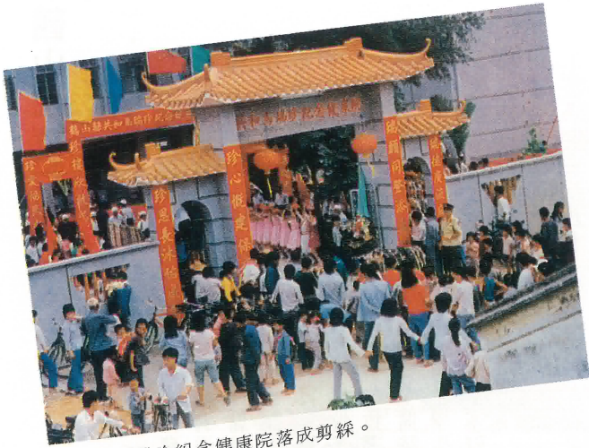
共和鎮馬瑞珍紀念健康院落成剪綵。